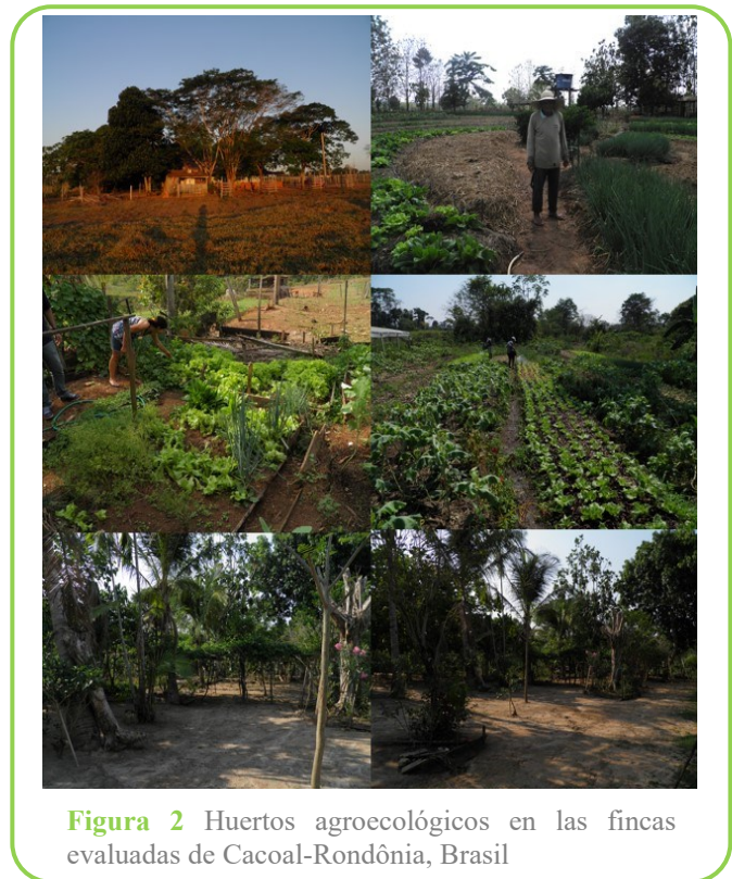
Figura 2 Huertos agroecológicos en las fincas evaluadas de Cacoal-Rondônia, Brasil

incluidos en las fincas visitadas y evaluadas (figura 2).