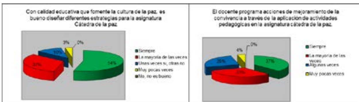
Gráfico 2: Percepción de los estudiantes frente a estrategias pedagógicas para la paz.

En las encuestas aplicadas se pudo identificar, además, que, actividades lúdicas encaminadas a la consecución de la paz y la sana convivencia en las aulas de las instituciones educativas son más atractivas para los estudiantes ya que dejan de ser rutinarias como las que se desarrollan en clase.