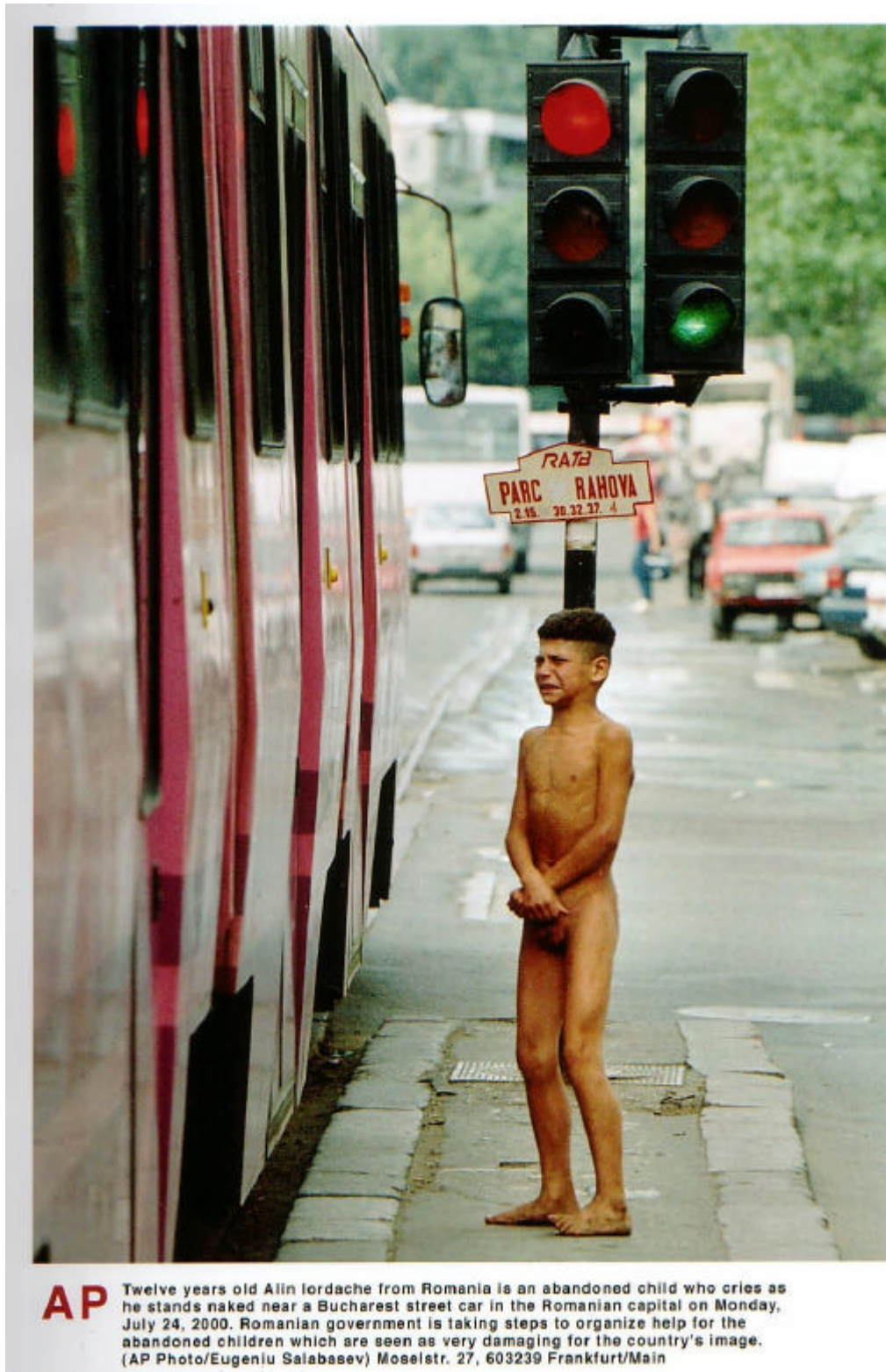
Abb. 1: Das Erregende der Nacktheit auf dem AP-Foto vom 24. Juli 2000

Notleidenden bestimmten Spenden verfehlten wegen defizitärer Organisationsstrukturen in aller Regel ihr Ziel.