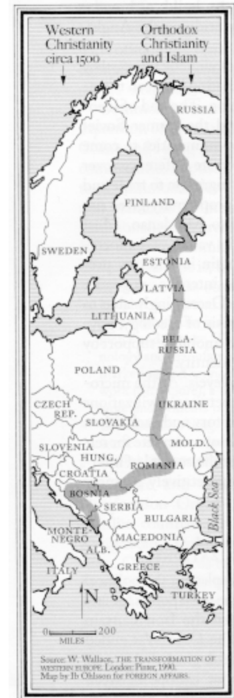
Taf. IIb Huntingtons Karte aus: Foreign Affairs , Summer 1993, Beedhams Karte präzisierend