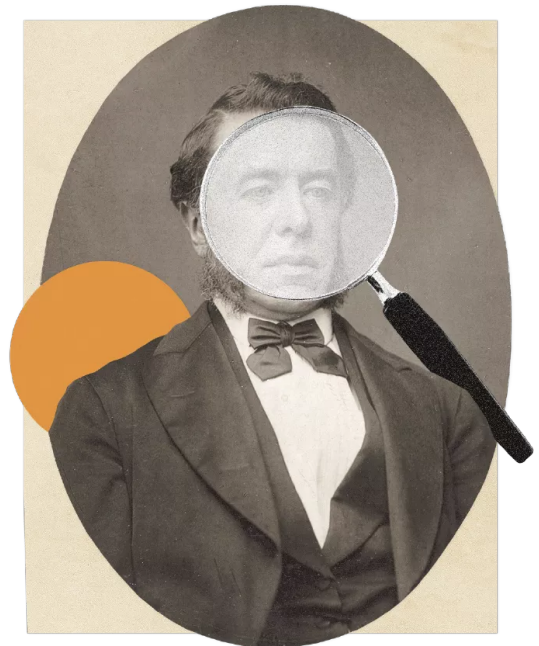
Robert Fruin , de eerste hoogleraar Vaderlandse geschiedenis