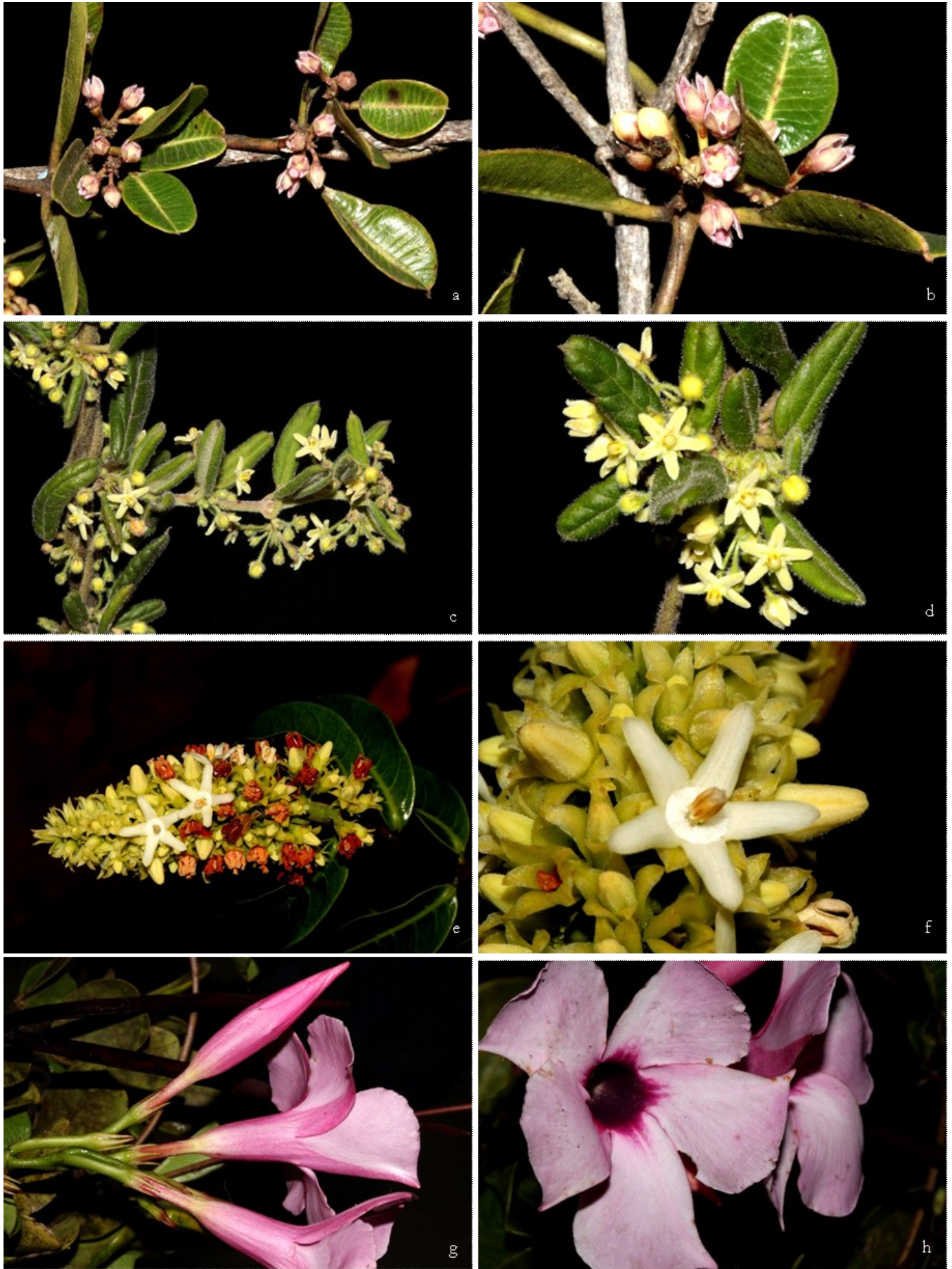
Figura 2. Apocynaceae de Vitória da Conquista. a-b. Ditassa lenheirens Silveira Azevedo & Caires 1323 (HVC). c-d. Ditassa pohliana E.Fourn. Azevedo & Caires 1325 (HVC). e-f. Forsteronia nitida B.F.Hansen Oliveira, Oliveira, Machado & Azevedo 18 (HUEFS, HVC). g-h. Mandevilla moricandiana (A.DC.) Woodson Marinbo 520 (CEPEC, HUEFS).