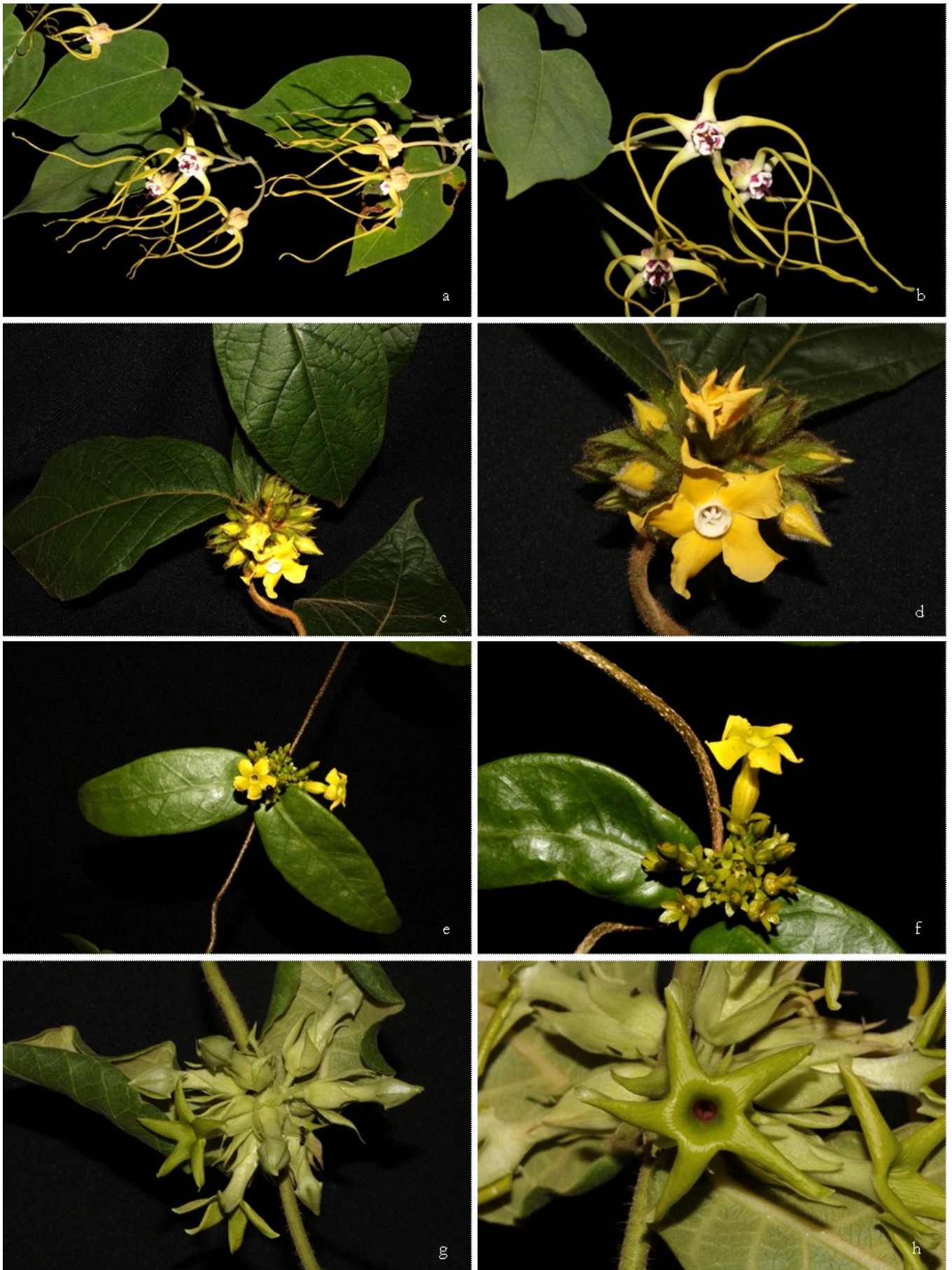
Figura 3. Apocynaceae de Vitória da Conquista. a-b. Oxypetalum arachnoideum E.Fourn. Azevedo 1320 (HVC). c-d. Prestonia bahiensis Müll.Arg. Azevedo 1287 (HVC). e-f. Prestonia coalita (Vell.) Woodson Azevedo 1283 (HVC). g-h. Schubertia morilloana Fontella Azevedo 953 (HVC).