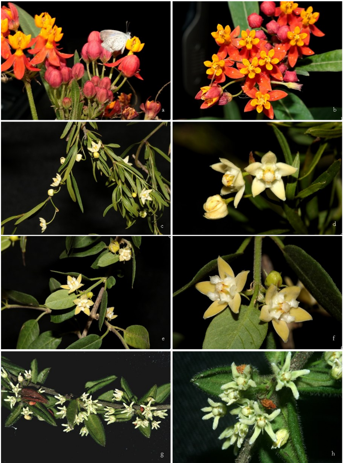
Figura 1. Apocynaceae de Vitória da Conquista. a-b. Asclepias curassavica L. Azevedo 1197 (HVC). c-d. Ditassa capillaris E.Fourn. Azevedo 1321 (HVC). e-f. Ditassa glaziovii E.Fourn. Azevedo 1241 (HVC). g-h. Ditassa hispida (Vell.) Fontella Marinbo 47 (HUEFS).