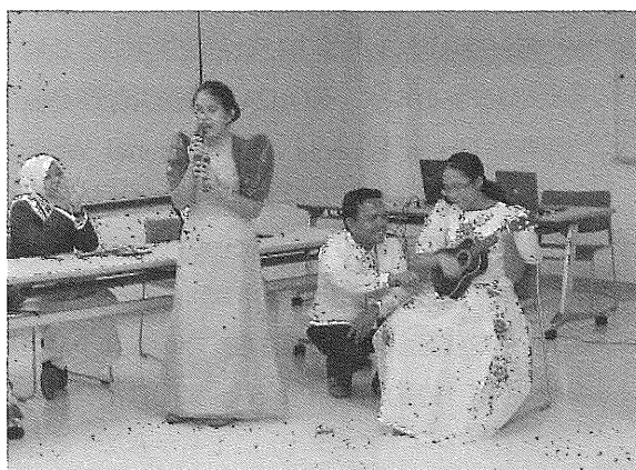
お互いの国の文化も紹介しあう (写真はフィリピン大附属高チーム)

各校からのプレゼンテーションの後には、「持続発展可能な社会づくりのために高校生ができること」をテーマ