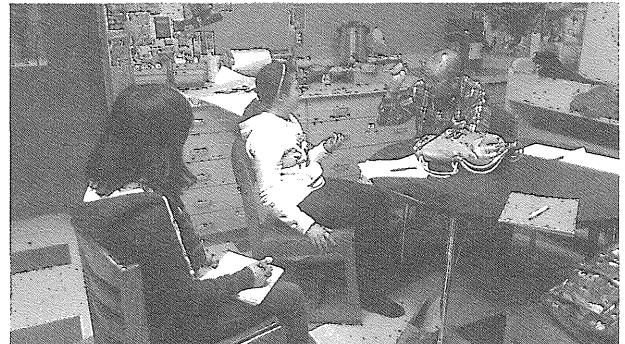
アメリカでESLの実際を見学する生徒C

問し調査活動を行った。なお、3名の生徒の活動については、本校主催の第17回総合学科研究大会（2014年2月20・21日）において生徒たち自身が報告を行った。