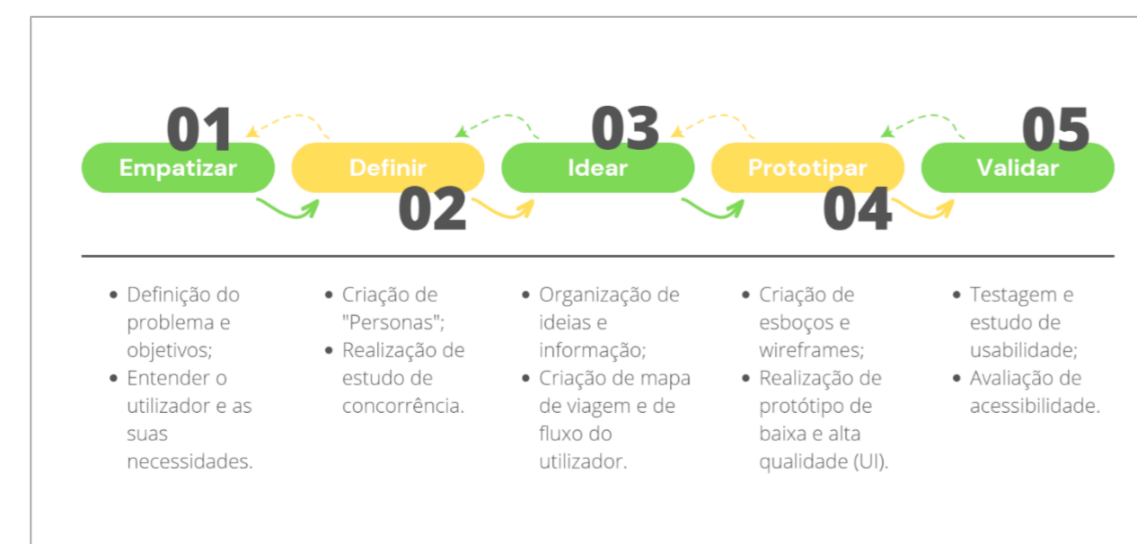
Fig.1 – Esquema da metodologia aplicada

A metodologia usada para o redesign do logotipo e a proposta de uma nova sugestão de website foi Project Based Learning, com as seguintes etapas: investigação em análise sobre o utilizador, e posteriormente sobre o mercado atual, nomeadamente, o que empresas do mesmo setor produtivo apresentam como identidade e a sua presença online. Foram também realizadas análises sobre o conteúdo e ferramentas que a empresa utiliza, encontrando pontos a melhorar e estratégias para o fazer. Seguidamente aplicou-se todo o conhecimento adquirido e desenhou-se uma nova sugestão de logotipo e website. Por fim, procurou-se obter validação, através de entrevistas a clientes atuais da loja. Já para a conceção da aplicação, focou-se no estudo do utilizador, com a aplicação de Design Thinking, com os seguintes pontos, empatizar, definir, idear, prototipar e validar, mais especificados no esquema a seguir.