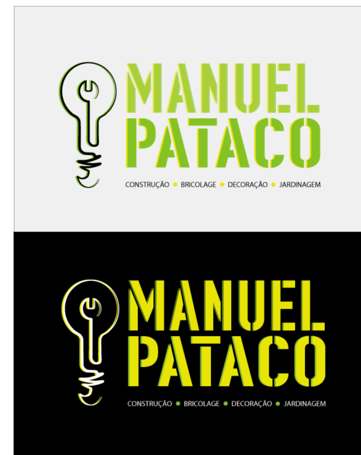
Fig.2 – Variação de cores do logotipo final

No final deste processo obteve-se uma identidade mais contemporânea para a empresa Manuel Pataco e um website mais acessível, apelativo e fluído. Como produto, também se obteve uma aplicação para compras online inteligível e em correspondência aos outros elementos desenvolvidos, mantendo-se coerência na identidade visual da marca.