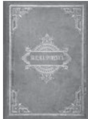
Školska spomenica Opće pučke škole u Vugrovcu. Vugrovec, 1897. – 1963. (HŠM A 4658)