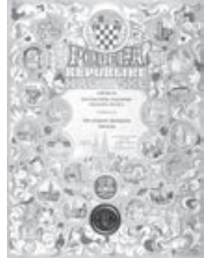
Povelja Republike Hrvatske Hrvatskom školskom muzeju. Zagreb, 2001. (HŠM 4654)

Pojedinačno arhivsko gradivo o školovanju, djelovanju i životu jedne osobe čuva se u Zbirci školskih, osobnih dokumenata i rukopisa . Veći dio izvornoga gradiva odnosi se na školske dokumente i rukopise/radove s temama iz pedagogije, didaktike, metodike, povijesti školstva. U Zbirci se čuvaju učeničke školske svjedodžbe,