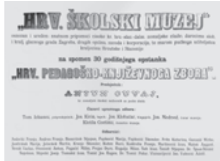
Spomen-diploma o osnutku Hrvatskoga školskog muzeja i 30. obljetnici Hrvatskoga pedagoško-književnog zbora. Zagreb, 1901. (HŠM A 597)

Arhivski fond Hrvatski školski muzej sadržava gradivo Muzeja od osnutka do 2020. godine. 9 Normativni akti, zapisnici upravnih tijela, poslovna i računovodstvena dokumentacija, muzejska dokumentacija i priznanja glavne su serije fonda. Tako je sačuvana Diploma o osnutku Hrvatskoga školskog muzeja iz 1901., zatim knjige Pohodnici HŠM-a i Darovi HŠM-u , vođene od 1901., u kojima pratimo posjetitelje i darovatelje Muzeju u prvim godinama postojanja, najstariji imovnici – knjige inventara muzejske, arhivske i knjižnične građe, te knjige dojmova, priznanja i zahvale Muzeju za uspješna ostvarenja muzejskih projekata te brojne suradnje sa školama i drugim obrazovnim, znanstvenim i kulturnim ustanovama u Hrvatskoj i inozemstvu. Najviša priznanja su Povelja Republike Hrvatske i Nagrada Grada Zagreba iz 2001. za izvedbu stalnoga postava.