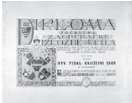
Počasna diploma Zagrebačke izložbe učila Hrvatskom pedagoško-književnom zboru. Zagreb, 1892.