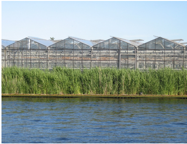
De glastuinbouwsector maakt al decennialang gebruik van de inzet van arbeidsmigranten