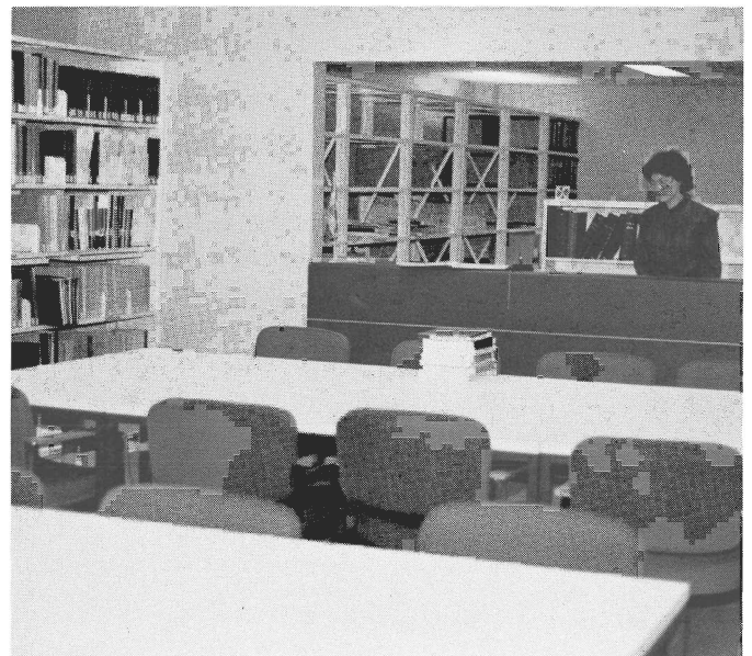
Salle des chercheurs et, à l'arrière-place, la salle de traitement.

En conclusion, je vous rappelle les heures d'ouverture du centre: du lundi au vendredi, de 8h30 à midi, et de 13h00 à 16h30. Le mercredi soir, de septembre à juin, de 19h00 à 22h00.