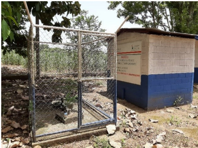
Figura 2. Pozo perforado, comunidad Campirano Norte.

Las 20 fuentes de agua por comunidad corresponden a: Las Parcelas (1), Capulines (1), Paniquines (2), Pueblo Nuevo (1), Playones (1), Kilaquita (1), Santa Rita (1), Virgen de Hato (2), El Manguito (1), El Tintal (2), Los Portillos (1), Las Salinas (1), Campirano (2), Sasama (2), Pedro Pablo (1), las cuales suministran agua a un aproximado de 1 496 familias (5 760 personas). Doce fuentes corresponden a pozos perforados, la mayoría abastece mini acueductos por bombeo eléctrico, presentan infraestructura de concreto y cerca de protección; ocho son pozos excavados a mano ubicados en patios de las viviendas, la mayoría con brocal, bomba de mecate y delantal, pero algunos carecen de delantal. En varias de las fuentes (Figuras 2 y 3) se observaron factores de riesgo, tales como desechos orgánicos e inorgánicos, áreas de cultivo donde se usan agroquímicos, animales domésticos, charcas y aguas grises.