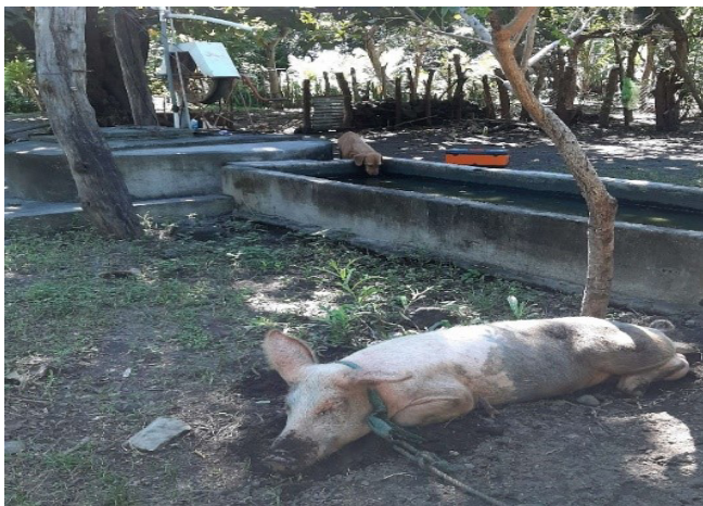
Figura 3. Pozo excavado a mano, comunidad Paniquines.

Los valores obtenidos de la evaluación de parámetros físico – químicos en agua de los pozos perforados (Cuadro 2 y 3) y excavados a mano (Cuadro 4), indican que el agua de la mayoría de las fuentes es aceptable para el consumo, ya que están por debajo del Valor Recomendado o Máximo Admisibles establecidos en la Norma regional CAPRE (1994) y/o las Guías de Calidad de Agua de la OMS (WHO, 2018). Según la WHO (2018, p. 8), “puede haber numerosos productos químicos en el agua de consumo humano; sin embargo, solo unos pocos representan un peligro inmediato para la salud en alguna circunstancia determinada”. Pero, es necesario analizar el comportamiento de ciertos parámetros que a mediano a largo plazo pueden representar riesgo para la salud de los habitantes que utilizan el agua de las fuentes estudiadas.