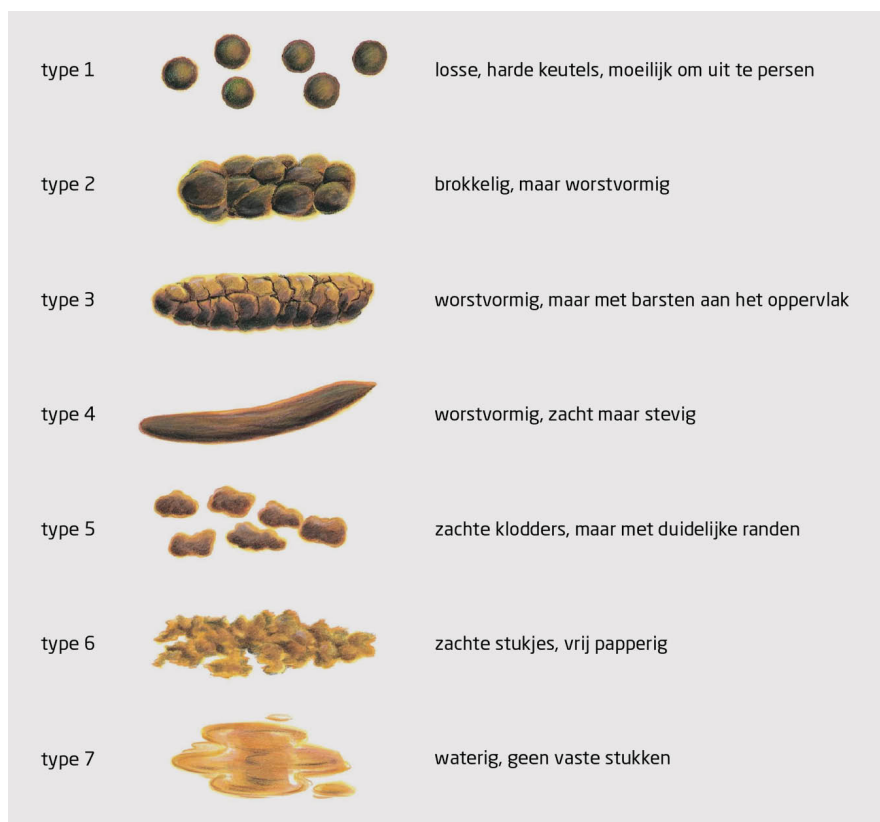
Figuur 1 De Bristol-stoelgangkaart

Wanneer de patiënt 2 of meer van de genoemde symptomen heeft bij meer dan 25% van de defecatiemomenten, er geen organische verklaring wordt gevonden en deze klachten langer dan 6 maanden aanhouden, is er volgens de Rome IV-criteria sprake van functionele obstipatie (tabel 1). 3