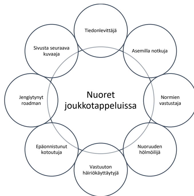
Kuvio 2. Joukkotappeluihin liitettyjen nuorten roolit

Joukkotappeluihin osallistuvat nuoret näyttäytyivät aineistossa niin aktiivisina toimijoina kuin myös passiivisina sivusta seuraajina. Osa nuorista oli selkeämmin aktiivisia toimijoita, jotka eritoten osallistuivat tappeluihin fyysisesti tai olivat järjestämässä niitä. Passiiviseksi sivusta seuraajiksi katsoin kuuluvan nuoret, jotka osallistuivat joukkotappeluihin niitä seuraten ja kuvatun sekä tietoa tappeluista levittäen. Olen nimennyt aineistosta analyysin perusteella joukkotappeluihin osallistuville nuorille rakentuvat roolit (Kuvio 2). Aineistossa näitä mielikuvia nuorista rakensivat muun muassa poliisit, nuorisotyöntekijät, tutkijat, järjestöjen edustajat, kansalaiset sekä nuoret itse.