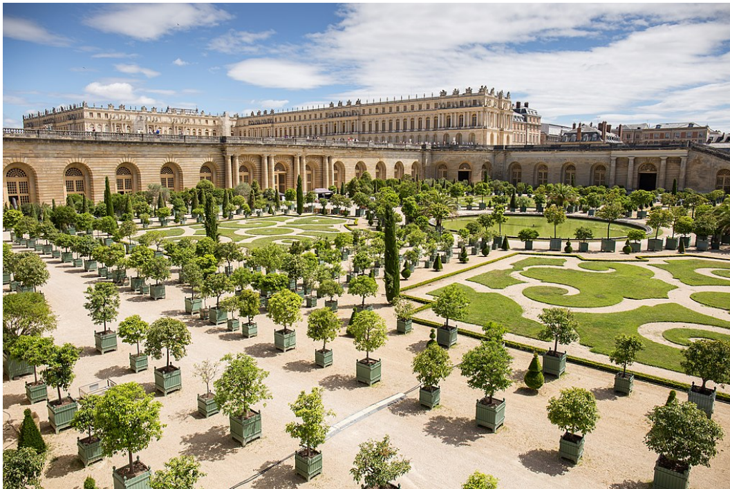
Figur 2. För att ge oss en bild av hur en renässansanläggning kan se ut. Orangeriet i Versailles.