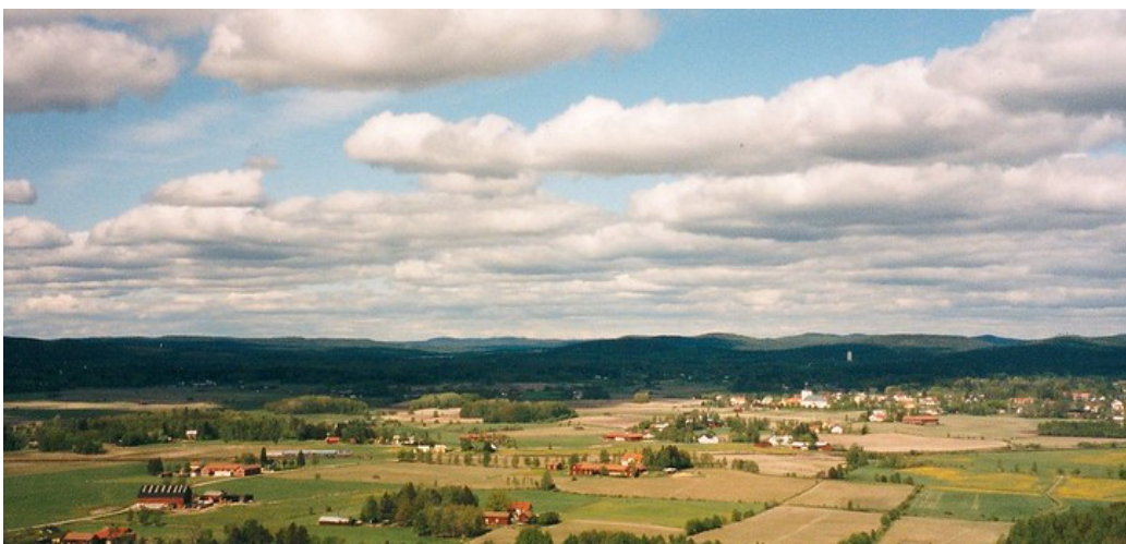
Figur 1. Bild på ett landskap som kan uppfattas som ett typiskt svenskt landskap, ett slättlandskap eller ett odlingslandskap, beroende på vem som definierar det.