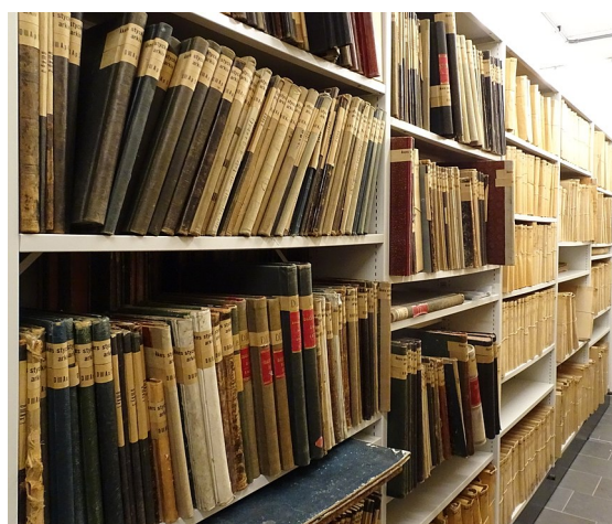
Figur 6: En bild på ett arkiv som exempel.