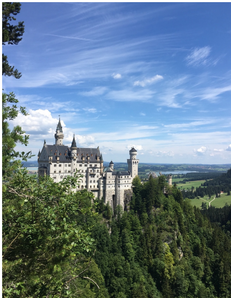
Figur 9. Hur en historisk anläggning kan förgylla landskapet.