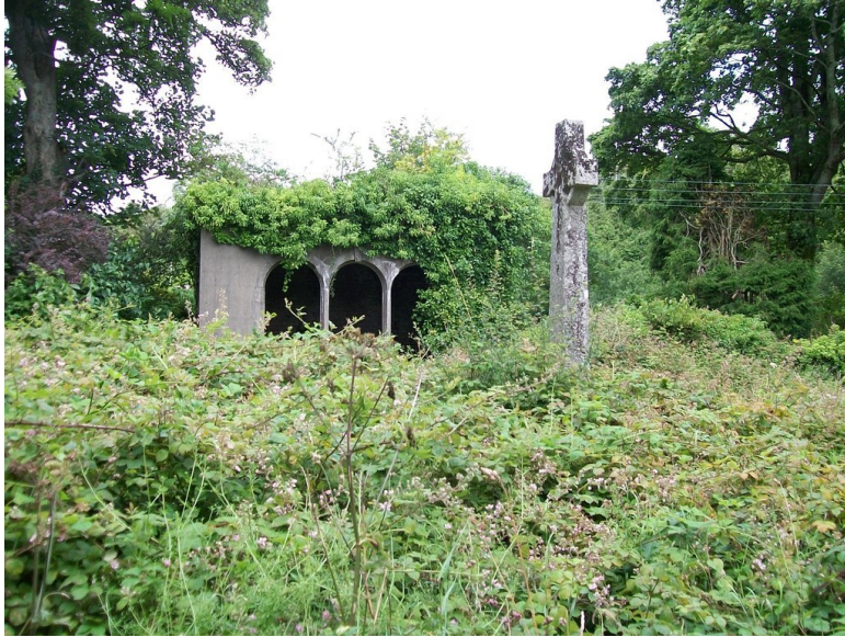
Figur 7. Ett exempel på hur naturen lätt kan ta över en plats.

den kulturen där en bygger, en designer och en sköter platsen, vilket bidrar till en kommunikationsbrist, vilket även I4 tar upp. I4 förklarar dock att de arbetar mer tätt med sin markentreprenör som även har hand om skötseln, vilket skapar en bra grund för att skötseln ska fungera. Hon fortsätter även med att säga att om det är en finare park kräver det även en högre skötselnivå, vilket gör det ännu mer betydelsefullt att arbeta tätt ihop med skötselpersonalen.