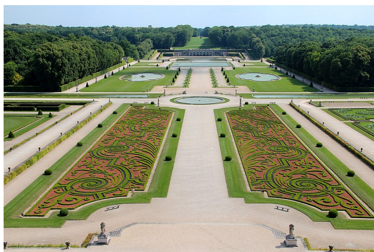
Figur 5. En barockanläggning i Frankrike.