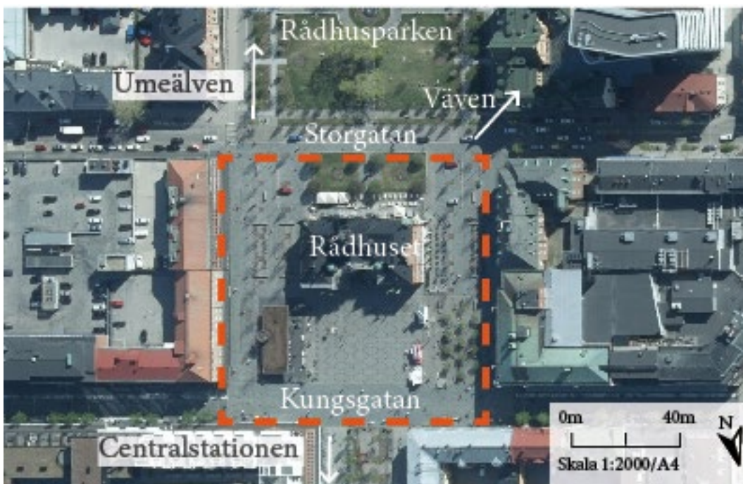
Figur 1. Rådhusorgets yta definieras inom den orange streckade rutan. Det är Umeås mest centrala plats med närhet till lokala landmärken som Umeälven, kulturhuset Väven, Rådhusparken och Centralstationen. Illustrationer av Rubertsson & Thunberg 2023, Flygfoto © Lantmäteriet 2023.

Rådhusorget är placerat intill Rådhuset som ligger i mitten av stadens stadsaxlar (se Figur 1). Rådhuset utgör en mittpunkt i staden och har tidigare varit en plats för bland annat post, fängelse och rättssal (Umeå kommun 2021). Idag tillhandahålls inga av de nämnda funktionerna i Rådhuset utan det består istället av restaurang och bar. Byggnadens karaktär sätter en stark prägel på torget (Sweco 2015:5). Rådhusorget är en viktig del av stadssammanhanget och de offentliga rummen i staden (Umeå kommun 2021). Torgets norra del tar upp lika stort utrymme som en fotbollsplan på 70 x 100 meter (Sweco 2015:8). Rådhusorget beskrivs i gestaltningsprogrammet som en plats för folket, både historiskt sett och i nutid. Torghandel har varit en funktion som torget ständigt tillhandahållit. Idag ska en rad funktioner tillhandahållas på torget, exempelvis uteservering, offentliga sittplatser, parkering, konstverk och talmöjligheter (Sweco 2015:10). Det centrala partiet är öppet och har syftet att användas till evenemang och möbleras efter årstiderna, det utgör ett rum för tillfälliga evenemang såsom konserter, bio och marknader (Sweco 2015:12). Idén bakom gestaltningen av Rådhusorget är att lösa flera funktioner men framförallt skapa en attraktiv plats som stärker Umeås identitet (Sweco 2015:7).