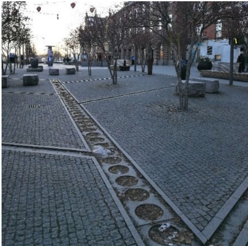
Figur 12. Vattenrännorna är inte i bruk under vintern och då verkar det finnas en tendens att skräp och löv samlas upp i rännorna.

Under platsbesöken noterades att det inte fanns särskilt mycket klotter och nedskräpningen var begränsad. Papperskorgar finns utplacerade bland annat nära sittplatser och kafébyggnaden. Däremot verkar det som att skräp lätt kan ansamlas i vattenrännorna (se Figur 12). Paradisäpplena från träden i äppellunden är en risk till nedskräpning ifall de inte plockas upp.