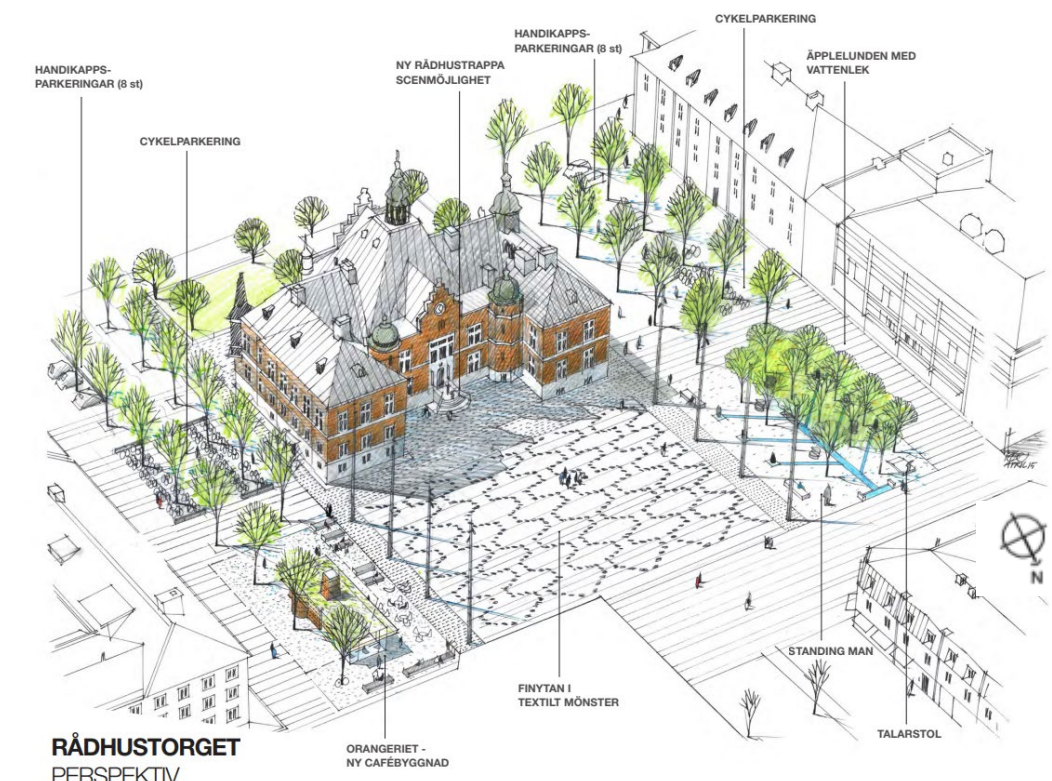
Figur 2. Perspektivbild som visar på olika delar av Rådhusorget. Genom bilden går det att få en uppfattning om hur rumsligheten upplevs. Sweco (2015:11).

ska även synliggöra torgets olika rum och funktioner som beskrivs nedan. Samtidigt ska stadens invånare lockas att sätta sig ner, stanna upp och betrakta omgivningen eller delta i olika aktiviteter på torget (ibid.). Torget består av åtta olika delar (se Figur 2) som kallas finytan, allépromenaderna, orangeriplatsen, äppellunden, torgramen, cykelparkeringen, bilparkeringen och uteserveringen (Sweco 2015:10).