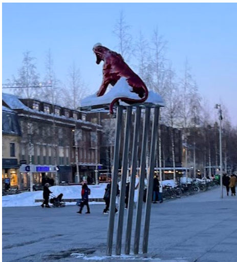
Figur 10. Fotografiet visar konstverket Listen som utgör ett element att beskåda på torget. Fotografi: Rubertsson & Thunberg 2023.

Stora delar av torget används som passage för att exempelvis ta sig till Kungsgatans shoppingstråk. Nödvändiga aktiviteter som att springa ärenden, shoppa och handla mat tillhandahålls i byggnaderna som omger torget. Torget skapar möjligheter för en del valfria aktiviteter. Dels finns sittplatser, både på uteservering och fasta bänkar som erbjuder valfria aktiviteter som att titta på människor eller sola. Dels finns element att titta på som vattenlek och träd i äppellunden, konstverk i form av en Camilla Akrakas konstverk Listen, som symbol för Metoo, och Sean Henrys skulptur Standing man (se Figur 10 och Figur 11). Likt tidigare nämnts upplevs de flesta sittplatserna exponerade och inbjuder inte till längre vistelser. Det finns inte heller några tillhörande bord eller liknande för att bjuda in till plats för att äta vid, bortsett från uteserveringen. Sociala aktiviteter som kommunala aktiviteter, evenemang och handel observerades under första platsbesöket då Världsmästerskapet i rally anordnades i Umeå vilket medförde andra tillfälliga aktiviteter på torget.