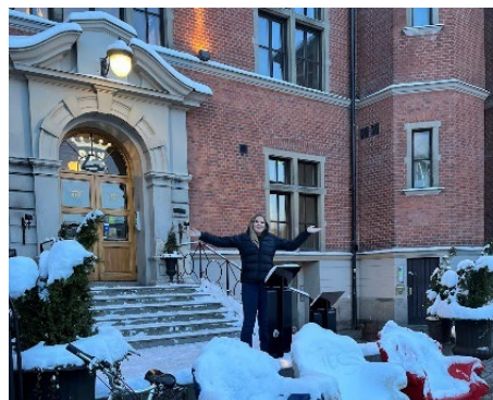
Figur 9. Fotografiet visar den verkliga upplevelsen av talarpodiet som till skillnad från illustrationen upplevs mindre dramatisk.