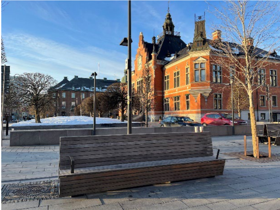
Figur 4. Den här bänken är placerad i det södra hörnet av torget och är ett exempel på de primära sittplatser som finns där.

som består av människor som passerar förbi. Andra primära sittplatser går att återfinna i hörnen av äppellunden. Dessa sittplatser ger en överblick på äppellundens vattenspel och växtlighet. Under de varmare månaderna brukar det även tillhandahållas flyttbara stolar i närheten av orangeriplatsen som kan användas av allmänheten.