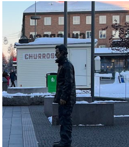
Figur 11. Fotografiet visar konstverket Standing man som till skillnad från Listen smälter in i omgivningen.