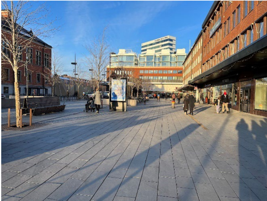
Figur 3. I närheten av cykel- och bilparkeringarna finns det sittplatser utplacerade. Att platsen främst används som passage kan bero på de breda gångstråken och bristen på intressanta vyer.

att stanna upp vilket kan vara ett resultat av fasadernas anspråkslösa utformning. Markbeläggningen på torgets sidor har en vertikal riktning vilket kan vara en bidragande faktor till att människor rör sig i ett snabbt tempo på platsen (se Figur 3).