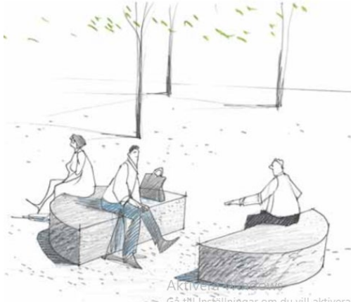
Figur 5. Illustrationen från gestaltungsprogrammet visar hur flera sällskap kan sitta på granitblocken samtidigt. Sweco (2015:19).