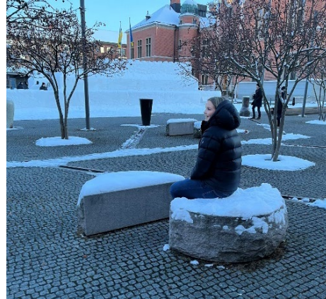
Figur 6. Fotografiet visar hur granitblockens storlek skiljer sig i verkligheten jämfört med illustrationen i figur 5.

De flesta bänkarna är placerade i de soligaste lägena, en del av dessa platserna hör dock till en kommersiell uteservering för restaurangerna Max och Ramen Café. Vid platsbesöket upplevdes en avsaknad av större gemensamma sittplatser för olika sällskap då det främst fanns mindre sittplatser och enskilda bänkar att välja mellan.