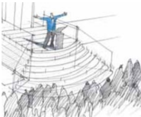
Figur 8. Utifrån illustrationen från gestaltningsprogrammet upplevs talarpodiet som effektfullt. Sweco (2015:3,22).

I gestaltningsprogrammet beskrivs äppellunden som ett rum som bjuder in till vistelse och lek (Sweco 2015: 19). Lekmöjligheterna i äppellunden kan anses bristande då granitblocken upplevdes för små och vattenleken inte tillräckligt fartfylld. Det finns tre talarpodier på torget där människor kan samlas och hålla tal. Dessa bjuder in till aktiviteter för den som vill säga något eller för enklare uppträdanden (Sweco 2015:19). Talarpodierna ska hjälpa till att aktivera torgets olika delar (Sweco 2015:22). De ger också möjligheter till människor att utöva sina demokratiska rättigheter som att demonstrera. Den stora talarstolen upplevdes inte lika dramatisk och storslagen som i gestaltningsprogrammet. Den kändes inte heller så inbjudande då den är placerad på en trappa framför Rådhuset och som idag utgör entré till en restaurang, vilket minskar känslan av att den är till för allmänheten (se Figur 8 och Figur 9).