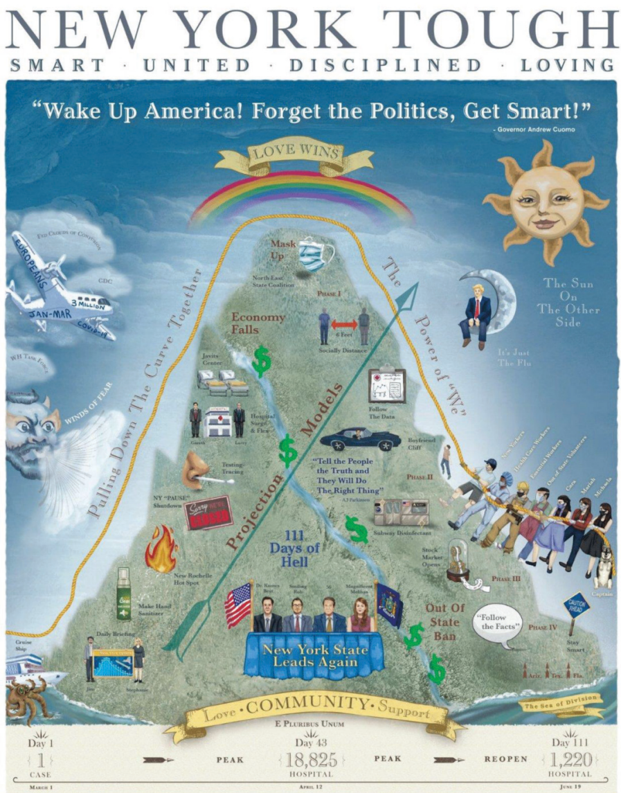
2. ábra. New York Tough plakát