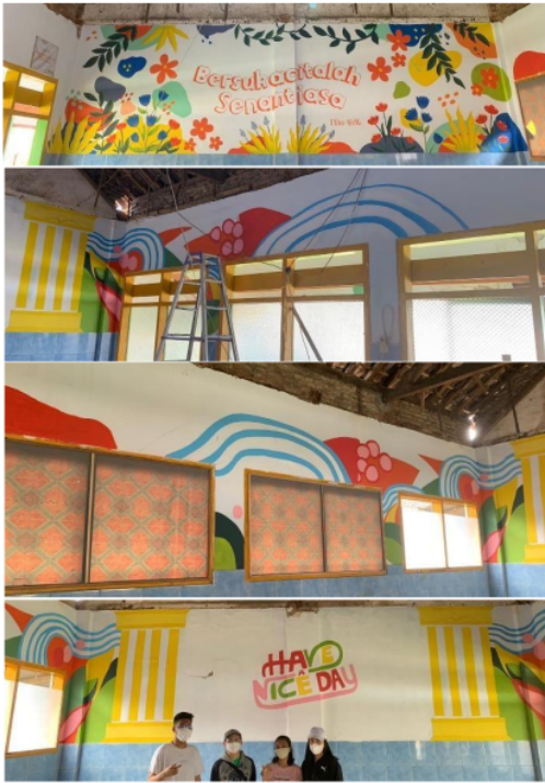
Gambar 13. Mural di tembok bagian dalam kelas