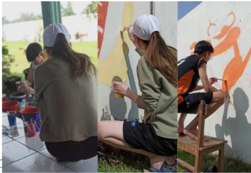
Gambar 5. Mural di tembok halaman dalam sekolah di hari kedua pelaksanaan.

Proses total pengerjaan mural di TK Gracia dan SDK YBPK Ngaglik Malang dilakukan mulai siang tanggal 24 sampai 26 Juni 2022 dini hari. Pada prinsipnya itu menjadi upaya solutif atas problem pertama, yakni penciptaan keindahan yang berfungsi sebagai daya tarik lembaga pendidikan tersebut. Problem kedua terkait penciptaan kesan dan nuansa khas anak level TK dan SD. Problem ketiga adalah terkait penciptaan efektivitas dan efisiensi dalam sinergi kolaboratif, dimana seluruh mural harus selesai di hari ketiga. Oleh tim Gugus Tugas kemudian diatasi dengan penciptaan visualisasi sederhana yang tidak menyeluruh pada seluruh tembok. Visual mural hanya bidang-bidang tertentu yang dianggap sebagai sentral pandangan mata ( center point ).