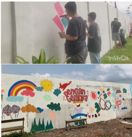
Gambar 7. Paramuda pria GKJW jemaat Sukun dan hasil karyanya.

Sukun. Spot itu bisa dipahami menjadi ajang mengekspresikan talenta seni rupa mereka. Melukis mural adalah satu aplikasi seni lukis yang cukup sulit bagi individu yang belum terbiasa. Mereka adalah orang awam yang biasanya menggambar dengan media kertas dengan posisi rebah di atas meja. Mural dilukis dipermukaan tembok dalam posisi tegak lurus. Objek lukisan paramuda pria itu tidak sulit, spot pertama hanya diperintahkan untuk menggambar bentuk-bentuk sederhana dengan warna warna yang menggambarkan keceriaan, maka hasilnya seperti tampak pada Gambar 7 bagian atas, berikut ini: