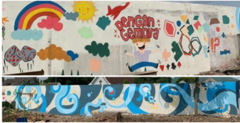
Gambar 9. Perbandingan karya mahasiswa yang berkolaborasi dengan paramuda putri (atas), karya paramuda pria GKJW (tengah) dan karya dosen DKV (bawah).

Spot tembok yang menampilkan lukisan mural karya paramuda pria itu diletakkan di tengah, diapit mural kolaborasi mahasiswa (dengan paramuda putri), dan dosen. Bidang mural yang dikerjakan paramuda pria menjadi bidang yang menyatukan antara lukisan yang ada dikiri dan kanan bidang gambar. Sebelah kiri adalah mural yang dikerjakan salah satu tim mahasiswa Prodi DKV Petra semester akhir. Mural yang disebelah kanan adalah karya salah satu dosen DKV. Nampaknya karya mural paramuda pria 'hendak menyatukan' kedua karakter mural yang dihasilkan dari dua entitas yang sama namun berbeda level. Karya paramuda itu dinilai cukup berhasil menjadi representasi yang tidak kalah menarik dibandingkan karya di kiri dan kanannya.