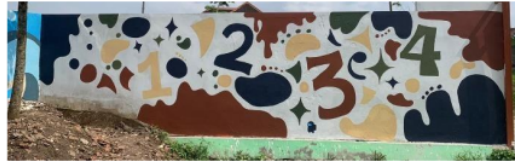
Gambar 10. Mural di tembok bagian depan dalam area sekolah.