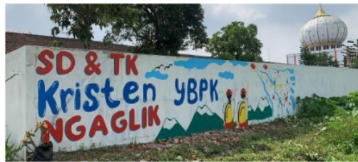
Gambar 11. Mural di tembok bagian depan luar area sekolah.