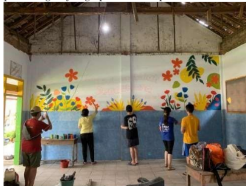
Gambar 2. Proses mural dinding di ruang kelas