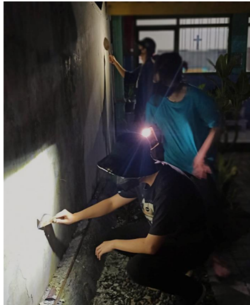
Gambar 1. Hari pertama proses pembersihan tembok dan sketsa awal. Belum disiapkan penerangan yang optimal oleh pihak sekolah.

Pengerjaan mural diawali dengan pembersihan tembok yang sebagian berjamur sehingga merusak lapisan cat dasar. Berikut dokumentasi dari pelaksanaan kegiatan itu (terdapat di foto-foto berikut ini):