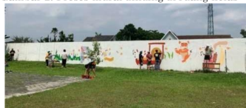
Gambar 3. Mural di tembok halaman dalam