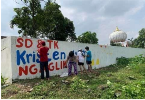
Gambar 4. Mural di tembok halaman depan luar