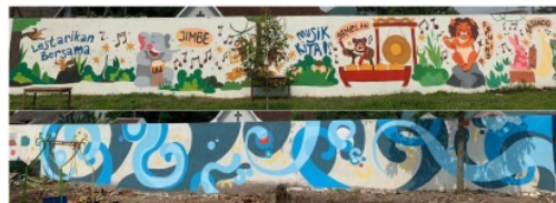
Gambar 12. Mural di tembok bagian samping dalam area sekolah.

Sedangkan bagian dalam ruangan dapat dilihat pada 4 foto pada Gambar 13, dibawah ini: