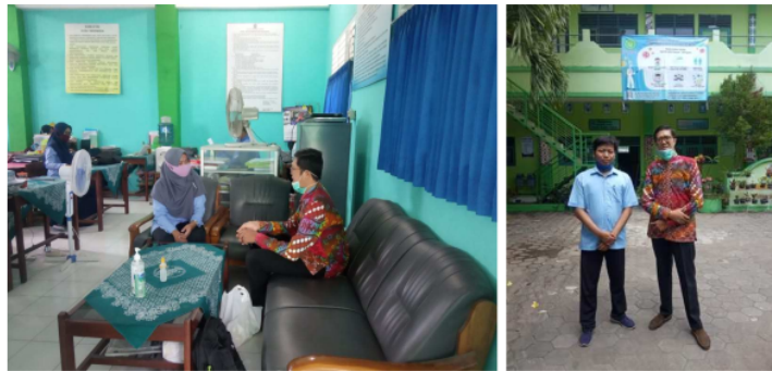
Gambar 1. Identifikasi Problematika Perilaku Bullying dengan Guru BK

Kegiatan pertama yang dilakukan adalah membangun FGD ( Focus Group Discussion ) terkait permasalahan aktual siswa terutama tentang perilaku perundungan ( bullying ) khususnya pada peserta didik di SMP Muhammadiyah di wilayah Bantul, yaitu SMP Muhammadiyah Kasihan, SMP Muhammadiyah, Sewon dan SMP Muhammadiyah Bantul. Hasil identifikasi berdasarkan angket pretes yang diberikan melalui google form menunjukkan bahwa terdapat peserta didik yang terlibat kasus bullying baik secara verbal, fisik, relasional, dan cyberbullying . Hasil menunjukkan bahwa peserta didik di SMP Muhammadiyah di Wilayah Bantul pernah diperlakukan dan melakukan perundungan ( bullying ) baik secara verbal yang dilakukan dengan ucapan secara sengaja maupun tidak sengaja dengan indikasi mengatai, memperolok, maupun menghina. Selain itu, peserta didik melakukan atau diperlakukan dengan perundungan ( bullying ) fisik yaitu melakukan kekerasan dalam sentuhan fisik. Selanjutnya, peserta didik melakukan dan diperlakukan dengan perundungan ( bullying ) relasional yaitu geng-gengan siswa yang suka membentuk kelompok dan melakukan gunjingan ataupun menindas anak-anak yang lemah dan sering sendirian. Terakhir, peserta didik melakukan atau diperlakukan dengan perundungan ( cyberbullying ) yaitu melalui aktivitas penggunaan media sosial ataupun smartphone yang disalahgunakan fungsinya.