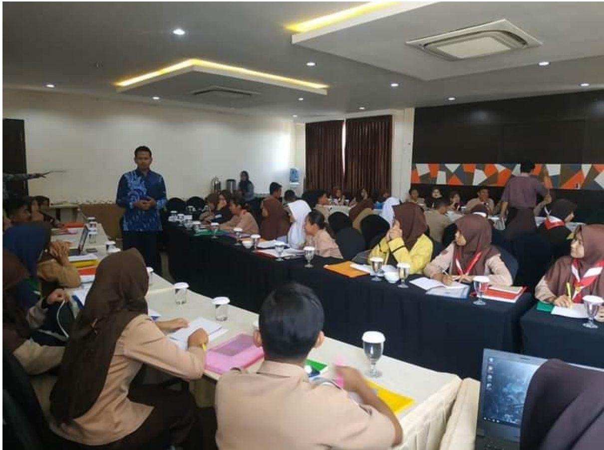
Gambar 3. Klinik Manuscrip Hari kedua

kegiatan juga menjanjikan akan diberikan souvenir bagi lima peserta terbaik, dengan indikator kesiapan artikel untuk dipublikasikan. Reward dari panitia ini cukup berdampak signifikan bagi peserta untuk mempersiapkan draft artikel. Hal ini cukup terlihat dari semangat dan antusiasme peserta untuk mengerjakan tugas membuat draft artikel yang ditugaskan oleh pemateri.