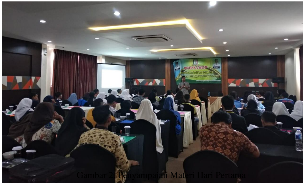
Gambar 2. Penyampaian Materi Hari Pertama

batang tubuh dan isi dari setiap bagian tubuh dalam sistematika artikel. Sesi kedua ini juga disambut dengan sangat antusias oleh peserta. Peserta terlibat aktif melalui berbagai pertanyaan setelah pemateri memaparkan slide materinya. Beberapa pertanyaan tersebut diantaranya: bagaimana cara menyajikan laporan penelitian yang jumlah halamannya seratusan lembar lebih menjadi hanya delapan atau duabelas halaman saja? Apakah semua hasil penelitian dibuat dalam satu artikel? Apakah hasil laporan penelitian kita dapat dibuat lebih dari satu artikel? Bagaimana cara mengutip hasil penelitian terdahulu untuk dimasukkan ke artikel kita?