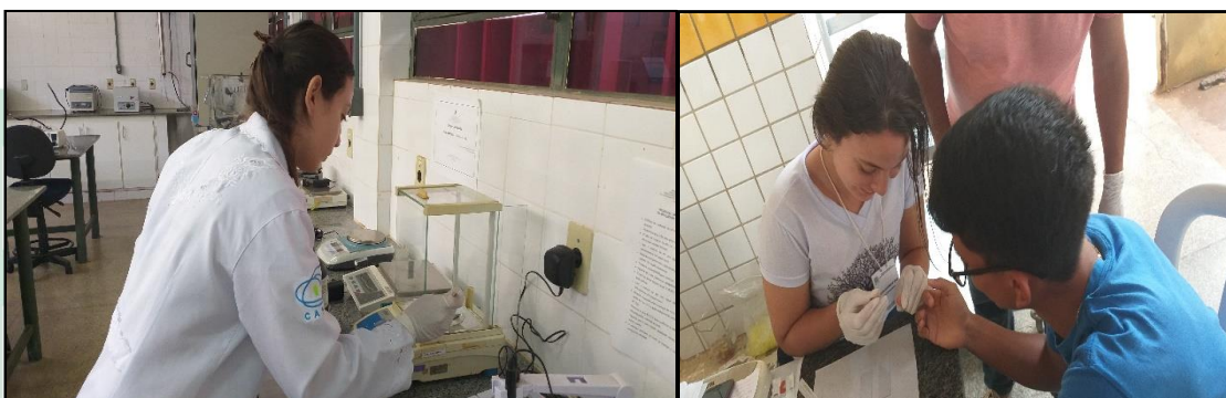
Figura 1: Atividades laboratoriais/práticas realizadas pela estagiária no ambiente não escolar.

O estágio não escolar foi realizado na Universidade Federal do Piauí – Campus Senador Helvídio Nunes de Barros, situada no Município de Picos-Piauí, com duração de 27 de fevereiro a 08 de março de 2019, nos turnos manhã e tarde, tendo como supervisora uma bióloga e técnica de laboratório. Ao decorrer desta experiência, foi possível perceber a atuação do graduado em Biologia no ambiente laboratorial a partir da análise participativa de atividades desenvolvidas pelos profissionais de laboratório, como o preparo de soluções e realização de testes clínicos, cujos estagiários puderam mobilizar conhecimentos específicos do curso de Ciências Biológicas (Figura 1).