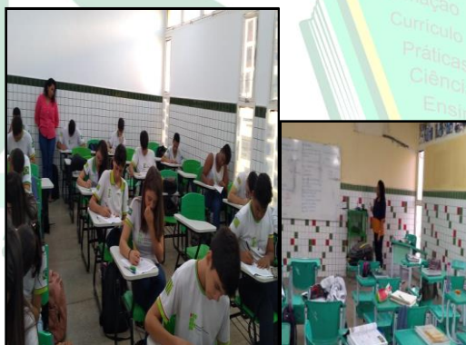
Figura 2: Observação participativa em sala de aula.

No ensino médio, o estágio foi realizado no Instituto Federal também localizado na cidade de Picos - PI, perdurando do dia 01 ao dia 29 de abril de 2019. A instituição oferta três cursos técnicos integrados ao Médio, os mesmos cursos na modalidade técnica, três cursos de nível superior, uma turma de PROEJA e uma turma de Especialização Latu Sensu , tendo no total 932 alunos matriculados, aproximadamente. Neste nível de ensino (médio), foram observadas três turmas de 2º ano dos cursos de Informática, Administração e Eletrotécnica, sendo caracterizado pelo método qualitativo descritivo e efetivado mediante observações feitas dentro da sala de aula (Figura 2).