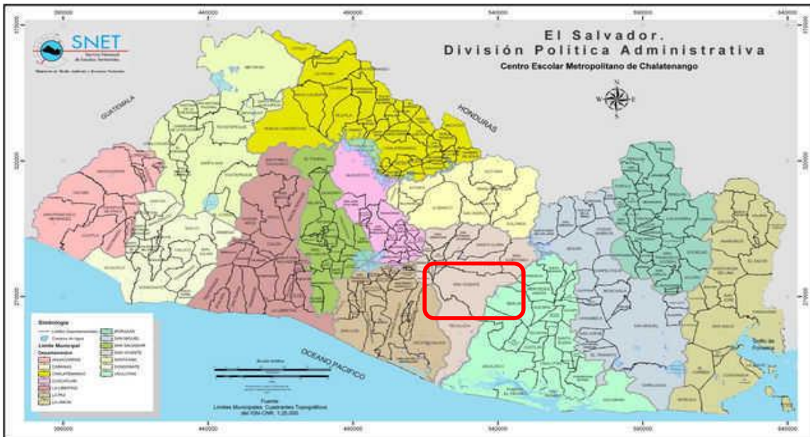
Mapa de El Salvador, municipio de San Vicente.