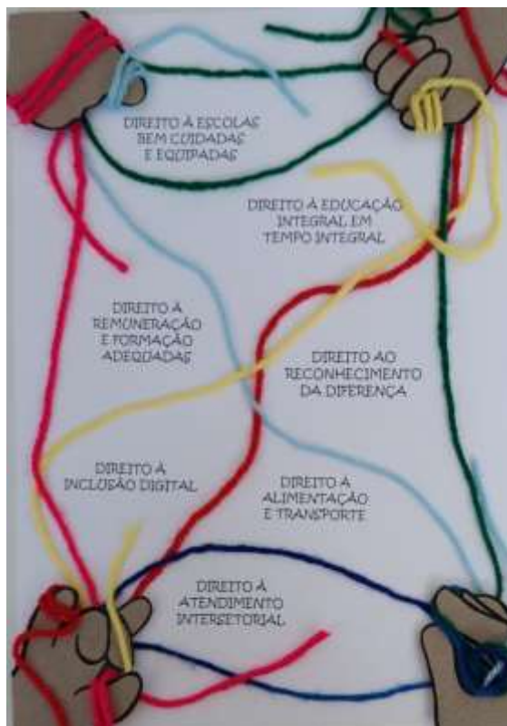
Figura 2 – Ilustração da Trama do Cuidado