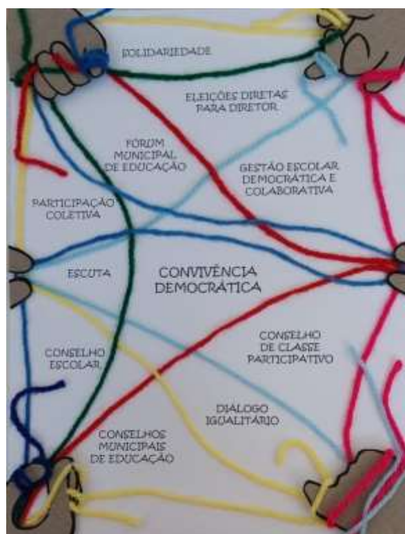
Figura 3 – Trama da Convivência Democrática

As demandas para a construção de uma convivência democrática nas escolas despontam em diversas passagens dos documentos analisados como um anseio a ser alcançado, sendo definido, inclusive, como ação prioritária das CAAFEs, conforme os encontros observados. A Trama da Convivência Democrática (Figura 4) explicita que a democratização das relações sociais ainda é um ideal a ser perseguido e concretizado no cotidiano escolar, a partir do cultivo a valores pautados pela “solidariedade, escuta, diálogo igualitário, participação coletiva” (REGISTROS DIA E), que necessitam configurar-se como essenciais no espaço/tempo curricular: