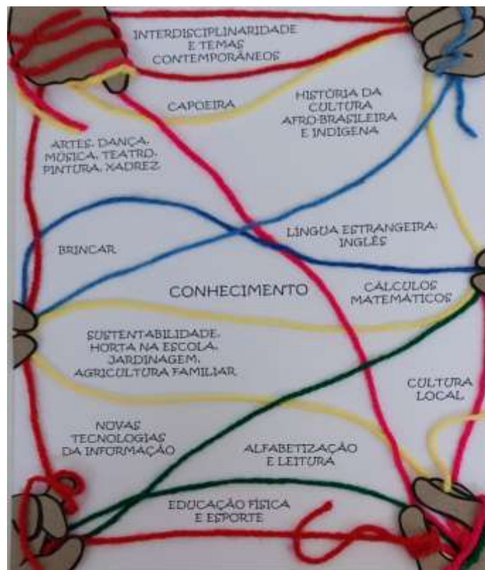
Figura 3 – Trama do Conhecimento

Além de tomar os cuidados a serem assegurados como direitos inalienáveis para a construção de uma vida digna, a justiça curricular, na visão de Ponce e Araújo (2021), observa a necessidade de também considerar conhecimentos que sejam assentados na valorização e no reconhecimento de saberes emergentes dos grupos que têm sido excluídos, conhecimentos que podem ser instrumentos de resistência a barbáries e representar novas possibilidades de ampliação do olhar humano para a vida. Por isso, a Trama do Conhecimento (Figura 3) busca elucidar quais conhecimentos despontam nas pautas de luta do Dia E em entrevistas e observações. Que conhecimentos podem ser considerados como significativos para o território vivido? Quais saberes, manifestados nesse contexto de produção de política curricular, realmente importam para essa população?