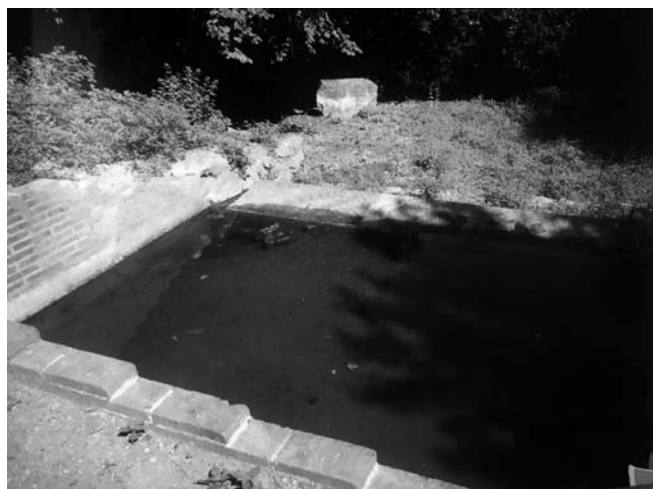
Figura 2. Font de Can Castellví (Vallvidrera, Barcelona).