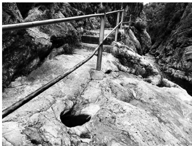
Figura 3. Toll a Fontcalda (Gandesa, Tarragona). Imatge: C. Pradera.

treig. La mostra consistia en 8 exemplars de Cx. laticinctus , 27 de Cs. longiareolata i 8 de Cx. pipiens . No es guarda mostra (Bueno-Marí et al. , 2016).