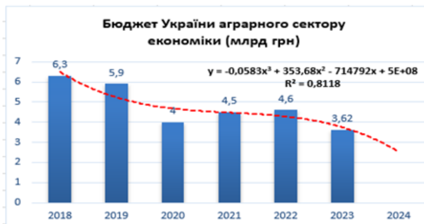
Рис. 2. Динаміка виділення держпідтримки для агросектору з 2018 по 2022 рік в Україні, млрд грн

Якщо порівняти бюджет України для аграріїв 2018 і 2022 року (рис. 2), бачимо різницю в 1,7 млрд грн. Якщо спрогнозувати бюджет до 2024 року, то можна визначити, що він досить точно описується поліномом третього ступеню, рівняння якого наведено на рис. 2. Про це свідчить значення коефіцієнту детермінації ( R^2=0,8118 ).