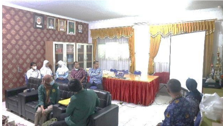
Gambar 2. FGD di SMP Negeri 21 Kota Bekasi

Negeri 9 dan SMP Negeri 21 Kota Bekasi. FGD di SMP Negeri 21 Kota Bekasi dilaksanakan pada tanggal 17 Juni 2022