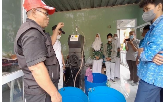
Gambar 9. Pengurus Bank Sampah Memberikan Penjelasan Tentang Mesin Pencacah Botol Plastik

pencacahan botol plastik menjadi bijih plastik yang memiliki nilai jual lebih tinggi untuk ke industri.