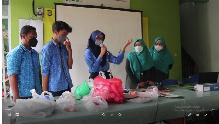
Gambar 7. Siswa SMPN 9 Kota Bekasi Melakukan Praktik Mengelompokkan Sampah Berdasarkan Nilai Ekonomisnya.

Kesempatan pertama diberikan kepada kelompok SMP Negeri 9 Kota Bekasi untuk menunjukkan pengetahuannya tentang jenis-jenis sampah dan contohnya.