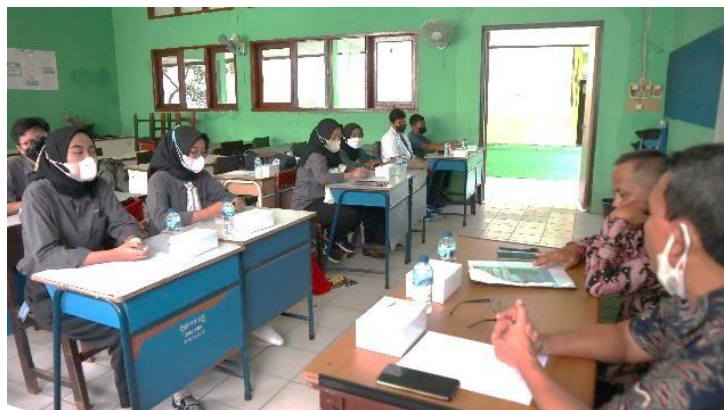
Gambar 3. FGD di SMP Negeri 9 Kota Bekasi

Tahap pelaksanaan pengabdian dilakukan dengan kegiatan kunjungan ke Bank Sampah Mutiara Kota Bekasi pada tanggal 27 Agustus 2022. Kegiatan diawali dengan sambutan dari Ketua Pelaksana, Ketua RT setempat dan Ketua Pengurus Bank Sampah Mutiara Kota Bekasi.