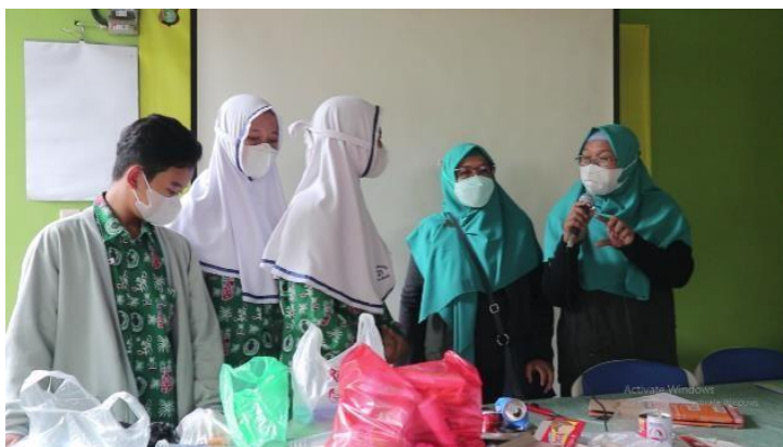
Gambar 8. Siswa SMPN 21 Kota Bekasi Melakukan Praktik Mengelompokkan Sampah Berdasarkan Nilai Ekonomisnya.

memilah atau mengelompokkan sampah sesuai jenisnya. Seperti pada gambar di bawah ini: