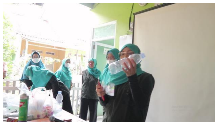
Gambar 6. Penjelasan tentang Sampah Plastik Oleh Pengurus Bank Sampah Mutiara Kota Bekasi

pencacahan botol plastik. Secara rinci pengurus bank sampah yang lain menjelaskan tentang klasifikasi jenis-jenis sampah berikut contohnya. Klasifikasi sampah seperti plastik bening, emberan, aluminium, besi, boncos, asoy, gelas plastik, botol plastik, kaleng, duplek, kardus, dan kertas putih.