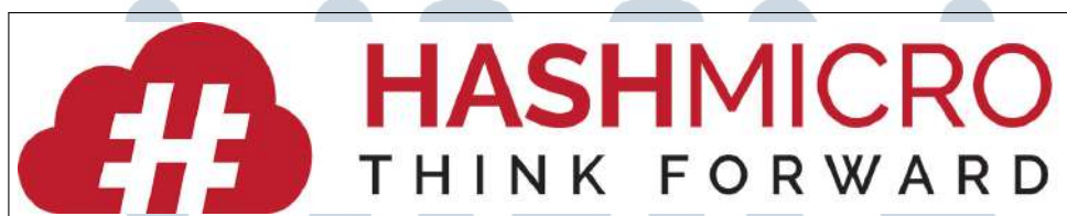
Gambar 2.1. Logo Perusahaan PT Hashmicro

PT Hashmicro merupakan salah satu perusahaan penyedia solusi ERP (enterprise resource planning) terbaik. Memberikan solusi otomatis yang mendukung kegiatan operasional bisnis dapat memaksimalkan potensi perusahaan dan bersaing di pasar global. Pada tahun 2015 PT Hashmicro membangun sebuah sistem berbasis cloud yang mengotomatiskan proses end-to-end operasi bisnis. Pada tahun 2016 pusat-pusat pengembangan mulai didirikan di India dan Vietnam. Kemudian pada tahun 2017, program software ERP Hashmicro sudah memenuhi syarat untuk subsidi pemerintah Singapura. Lalu, Pada tahun 2018, PT Hashmicro sudah resmi beroperasi penuh di Indonesia. Pada tahun 2019, PT Hashmicro telah mengembangkan pusat research and development di Indonesia serta membuat kesepakatan aman dengan lembaga pemerintah swasta Indonesia. Pada Tahun 2020, PT Hashmicro telah memperluas jaringan hingga Surabaya dan telah resmi beroperasi di Surabaya. Dan Pada Tahun 2021, PT Hashmicro, berjuang melewati pandemi serta membuka jalur bisnis baru yang berkembang dalam bidang Saas Equip ERP hingga hari ini [1].