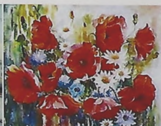
▲ Рис. 5 Фото картины «Цветы»