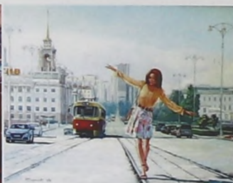
▲ Рис. 4 Фото картины «Летящая по проспекту»