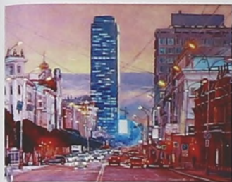
▲ Рис. 3 Фото картины «Малиновый вечер»