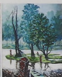
▲ Рис. 6 Фото картины «Торопливый шепот»

Картина «Торопливый шепот дождя» художника Льва Карнаухова (рис. 6) характеризуется эмоциональностью, яркостью, ассоциируется с уверенностью.