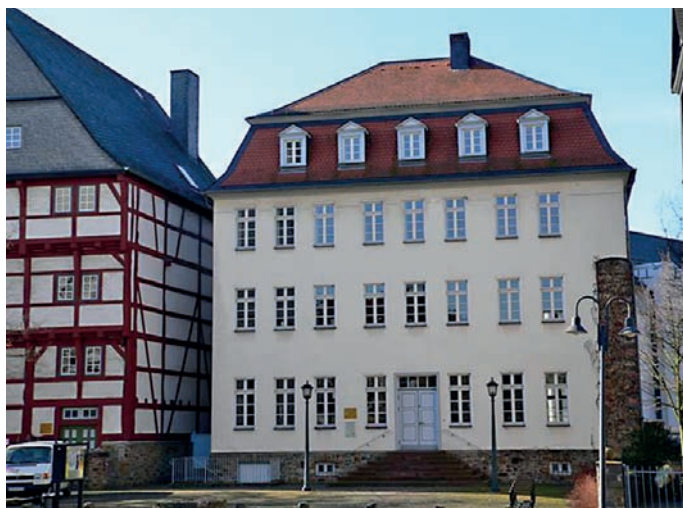
Abb. 1: Das Wallenfels'sche Haus am Kirchenplatz mit der Antikensammlung der Justus-Liebig-Universität Gießen