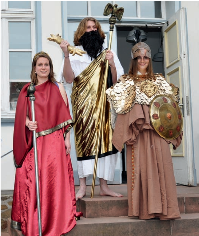
Abb. 4: Ein göttliches Begrüßungskomitee bei der Eröffnung von „Herakles und Co.“ (2010)