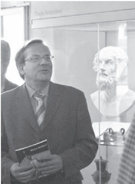
Abb. 2: Universitätspräsident Stefan Hormuth bei der Eröffnung der Ausstellung „Wahre Helden?“ (2007)

Mit der im Oktober 2007 eröffneten Ausstellung Gönner, Geber und Gelehrte konnte nicht nur die enge Verbindung und Bedeutung der Antikensammlung für die Geschichte der JLU verdeutlicht, sondern auch die von Anfang an existente und bis heute fortbestehende Vernetzung mit dem Gießener Bürgertum sowie die Bedeutung der Sammlung für die öffentliche Wahrnehmung der Universität klar herausgestellt werden. Für ihren erfolgreichen Einsatz wurden die an der Ausstellung beteiligten Studenten im Rahmen des akademischen Festaktes 2008 vom Präsidenten der Universität,