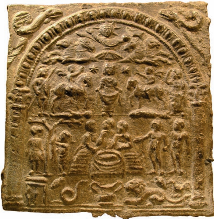
Abb. 6: Neu in der Gießener Antikensammlung: ein Weihgeschenk für die „Danubischen Reiter“ (3. Jh. n. Chr.)

Interesse ist eine Sammlung von 16 so genannten Donaufreileiefs – figürlich verzierte Bleireliefs, die während der römischen Kaiserzeit im Donauraum als Votivgaben gestiftet wurden. Teile dieser vom Umfang und von der Qualität her einzigartigen Kollektion sollen als Leihgaben anlässlich einer Ausstellung zu Mithras und anderen Mysterienreligionen auf der Saalburg gezeigt werden. Die Übereignung der Stücke bildet zudem den Anlass für eine im Herbst 2011 geplante Sonderausstellung im Wallenfels'schen Haus, die sich mit der Problematik von Raubgrabungen und illegalem Antikenbesitz befasst und die im Rahmen mehrerer Lehrveranstaltungen im Sommer 2011 vorbereitet wird.