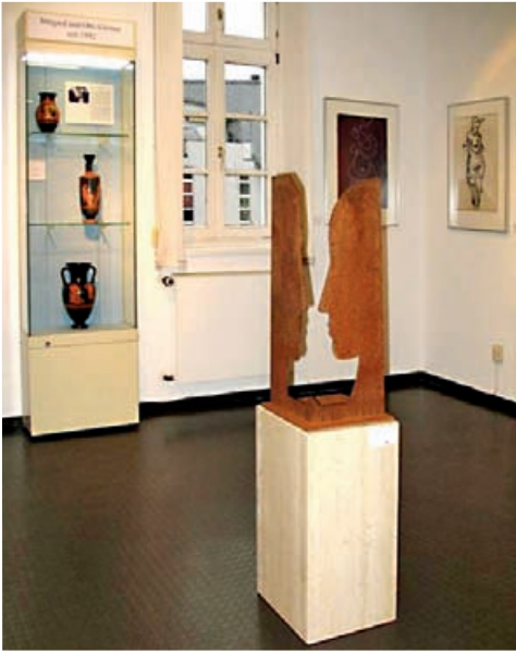
Abb. 3: Antike und moderne Kunst im Dialog: Werke von Donald von Frankenberg in der Antikensammlung (2008)

Prof. Dr. Stefan Hormuth, mit einer „Anerkennung für Arbeiten zur Geschichte der JLU“ ausgezeichnet.