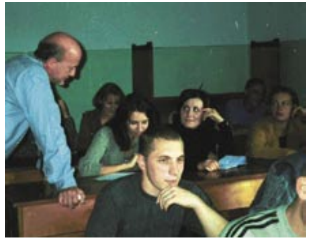
Sommerschule an der ukrainischen Partneruniversität

Primäres Ziel des Projektes ist die Implementierung eines neuen, modularen Lehrplans im Agrar- und Ernährungsbereich an der ukrainischen Partneruniversität. Die Durchführung des Vorhabens ist verbunden mit der Vermittlung neuer Lehrmethoden und der Unterstützung der Universität durch Lehrmittel und technische Ausstattung. Die Einrichtung eines Resource Centers mit Computern und wissenschaftlicher Literatur sowie eines chemisch-analytischen Labors sind zur Zeit in Arbeit. Weitere wesentliche Bestandteile des Projektes sind Studienaufenthalte von ukrainischen Studierenden und Lehrpersonal an den Universitäten Gießen und Lyon. Allein im ersten Projektjahr besuchten sieben Studenten und sechs Dozenten die Justus-Liebig-Universität sowie die französische Partneruniversität. In der ersten Hälfte des zweiten Jahres sind es bisher schon insgesamt 14. Gastvorlesungen in Form jährlicher Sommerschulen vor Ort und Konferenzen ergänzen das Programm. Im September letzten Jahres fand die erste Sommerschule unter dem Titel „Wirkungsanalyse und Bewertung wirtschaftspoliti-