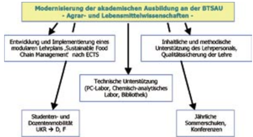
Abb. 2: Bausteine und Aktivitäten des Tempus-Projektes

Neben der inhaltlichen Lehrplangestaltung widmet sich das Projekt auch der Gestaltung und Anwendung neuer Ausbildungstechniken. Diese werden während der Aufenthalte von Studierenden und Lehrpersonal an den EU-Partneruniversitäten trainiert, aber ebenso durch westliche Lehrkräfte während der Sommerschulen an der BTSAU angewendet. Neben bewährten Veranstaltungsformen, wie Seminaren