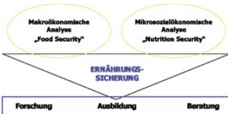
Abb.1: Ernährungssicherung im Arbeitsfokus der Sektion

Das spezifische Ziel ist einerseits, Verständnis für die Strategien und institutionellen Rahmenbedingungen zu wecken, die Basis einer Marktwirtschaft und unerlässliche