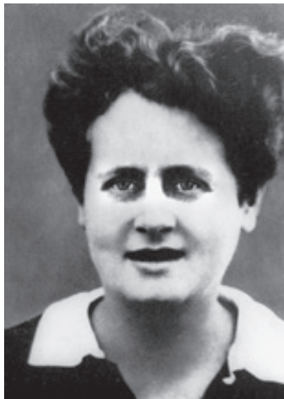
■ Milena Jesenská

■ Das „Café Milena“ in Prag, das inzwischen nicht mehr existiert.