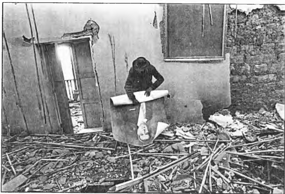
Figura 2: Vilcashuamán, Ayacucho, 1982.

Pero eso plantea otros problemas. Para empezar la imagen de Belaunde en esa foto no corresponde a la de su presidencia de 1980, sino a la de 1963, cuando tenía poco más de cincuenta años. Este detalle es extremadamente revelador. Por un lado, es un síntoma del aislamiento y el desfase que existe en una sociedad centralizada como la peruana, en la que Vilcashuamán no tiene una foto actual del presidente de la nación. Pero por otro lado es también revelador que la imagen rescatada sea la de un hombre de mediana edad y no la del Belaunde de 1980, ya casi septuagenario. La imagen que el anónimo campesino recupera es la una masculinidad hegemónica.