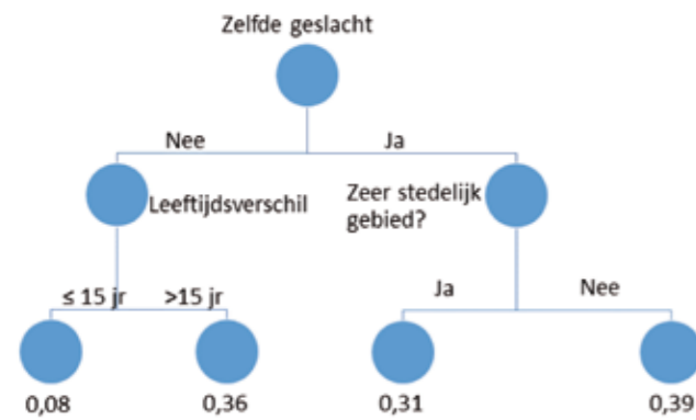
Figuur 1. Een fictief voorbeeld van een beslisboom

eindknoop van een boom, een zogenaamd blad, hoort bij een specifieke, homogene groep. Bijvoorbeeld alle duo's op één adres van hetzelfde geslacht met minder dan 15 jaar leeftijdsverschil. Voor ieder blad wordt er ofwel een waarde van de doelvariabele geschat (hier: de kans op twee huishoudens op één adres), of een correctie ten opzichte van een eerdere schatting.