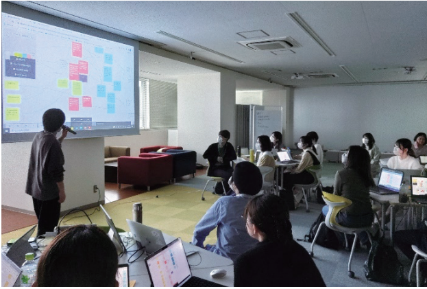
図 2 徳島大学 i.school 第 1 回ワークショップ風景 (対面開催。掲載にあたり参加者の許諾を得た)