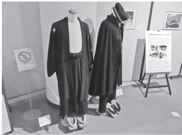
図1 四高生が身につけていた羽織・袴と詰襟・マント

この企画展は、2020（令和2）年6月19日から10月26日にかけて開催された。当初は、4月初めから開催する予定であったが、前述の通り、新型コロナの拡大で資料館の閉館措置が取られたことにより、開催は新型コロナの第1波が収まり、全国の非常事態宣言が解除されるまで待たなければならなかった。また、入館は学内関係者に限定された。なお、コレクション展は、平成27（2015）年度から毎年開催され6回目の開催であった。今回の企画展では、前年度に寄贈された古い写真資料の中から、本学の主要な前身校の一つである第四高等学校関連の写真に、学術資料を併せて展示し、当時の学校や学生生活を知ってもらえる展示とした。金沢駅頭で八高生を迎える四高応援団やカフェでくつろぐ四高生の写真は、当時の四高生の様子をいきいきと伝えていた。展示資料の中には、初公開になる1892（明治25）年撮影の第四高等学校建設草創期の写真も含まれていた。この展示には、入館制限の中、924名の入館者があった。