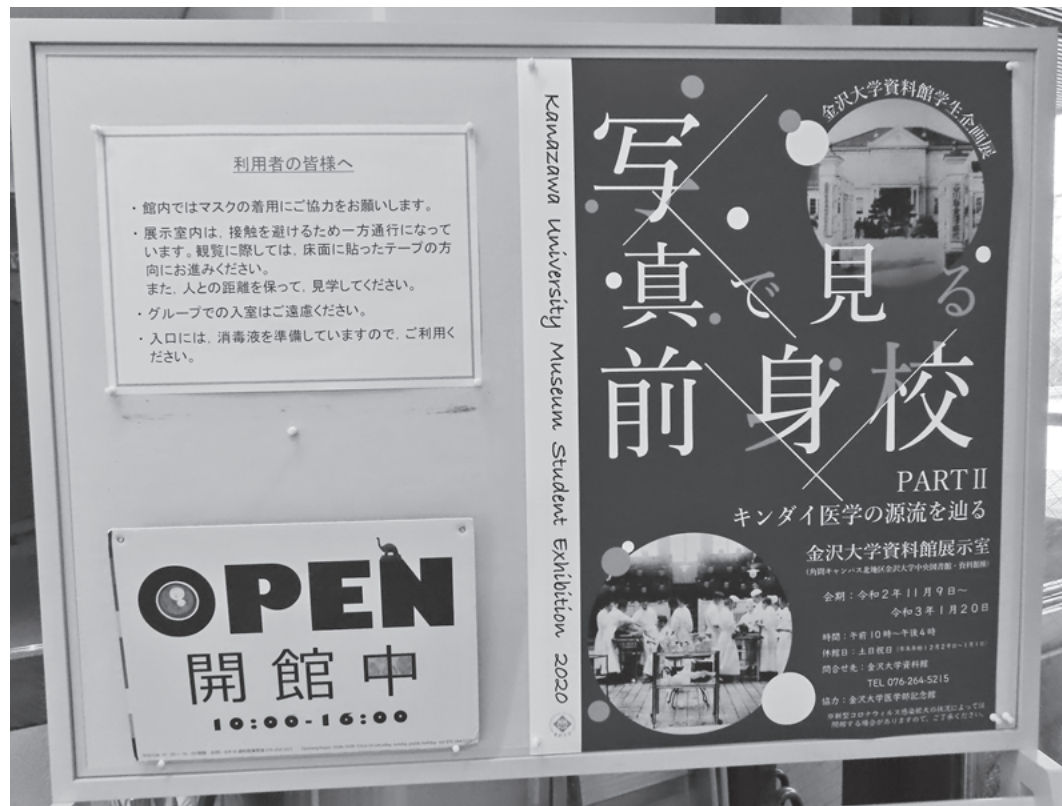
図2 学生企画展ポスターと入館者への新型コロナ対応メッセージ

精緻な植物書」、第4回「解体新書こそぞ噂話」、第5回「博士の愛したハサミ」、連日多くの学生等が参加した。このミュージアムツアーの様子を伝える動画が、YouTubeの金沢大学公式チャンネルで公表された。本展示会では、その興味深い展示やミュージアムツアーなどが人気を呼び、冬季かつ新型コロナ対応の入場制限の下で、603名もの入場者があった。