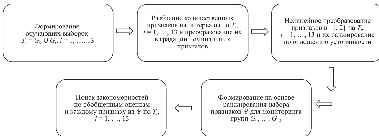
Рис. 1. Функциональная схема отбора информативных признаков