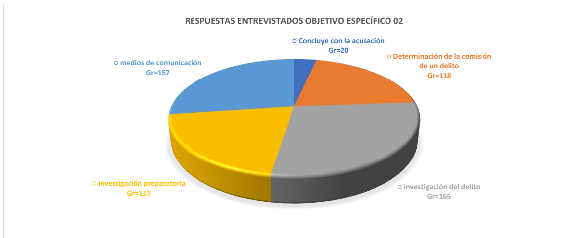
Resultados del análisis (OE2)

Nota. respuestas de los participantes entrevistados – objetivo específico 02