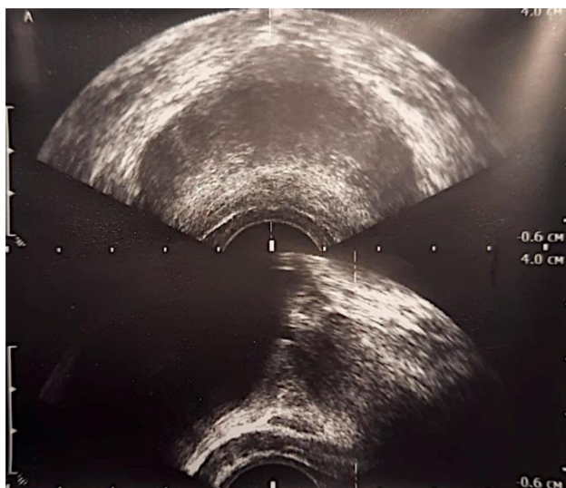
Рисунок 3. Скан эхограммы простаты (описание в тексте)

ТРУЗИ: Эхогенность органа неравномерно понижена, преимущественно в переходной и периферической зонах, граница между ними нечёткая (отёк?). Структура паренхимы неоднородная за счёт множественных линейных гиперэхогенных элементов в подкапсульных отделах и центральной зоне, вероятно за счёт фиброза стромальных структур. Объём простаты — 36,2 см 3 . Скан эхограммы представлен на рисунке 3.