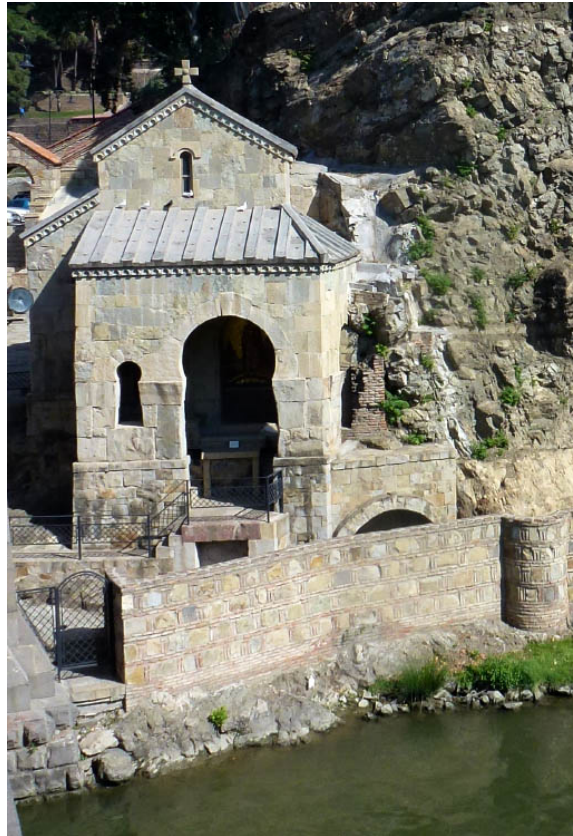
Ил. 4. Часовня Або Тбилисского. Фото Сергей и Маша Поповы.2012

Источник: https://sobory.ru/photo/145022