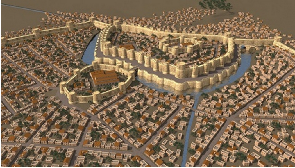
Ил. 1. Воссозданная 3D-модель древней столицы Армении Двина.