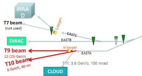
Fig. 2 Las diferentes líneas de haces de test que proporciona el CERN. En concreto, T9 para el concurso CERN-Beamline

En el año 2015 se desarrolló la segunda edición del concurso. Se presentaron, en la primera fase, 212 propuestas de 40 países de las cuales 36 fueron españolas, siendo la nación con mayor número de solicitudes. En los años siguientes el concurso ha seguido creciendo en participación y calidad.