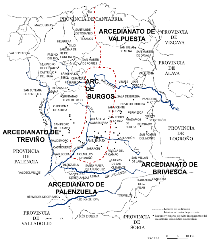
Mapa 1. Arcedianatos de la diócesis de Burgos (siglos XIII-XIV)