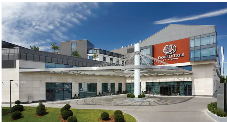
Slika 3. DoubleTree Hilton Hotel i konferencijski centar Varšave.

Na kongresu je sudjelovalo oko 1049 sudionika, iz 82 države svijeta. Od 1049 sudionika 815 je sudjelovalo uživo, a 234 online. Na ceremoniji otvaranja okupljene su pozdravili brojni uzvanici i predstavnici organizatora. Predsjednik FIG-a Rudolf Staiger također je