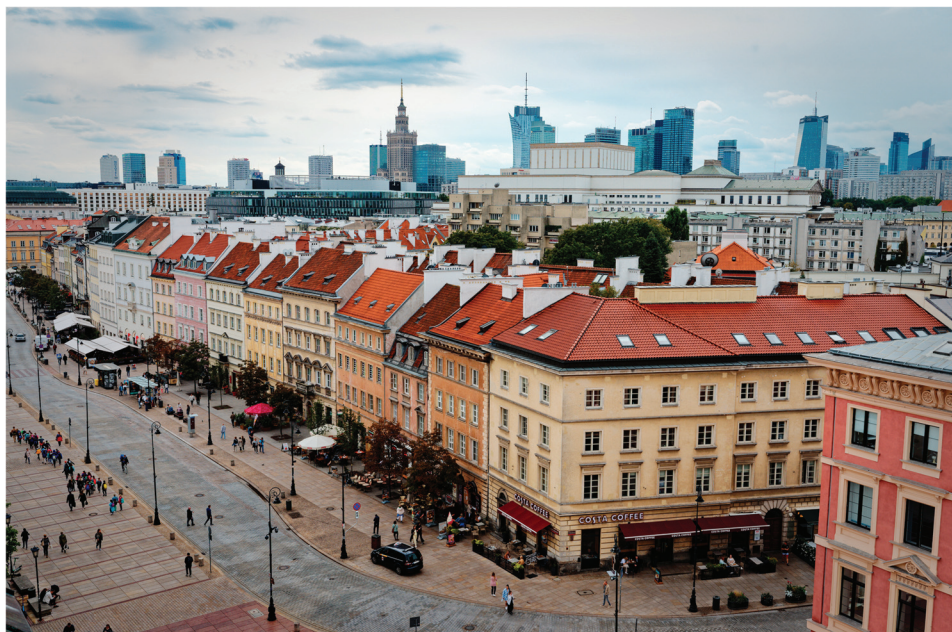
Slika 2. Pogled na poslovni centar Varšave preko stare jezgre grada.