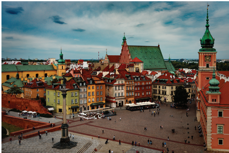
Slika 1. Centar Varšave, Poljska.

U Varšavi (slike 1 i 2), Poljska, od 11. do 15. rujna 2022. održan je XXVII. FIG kongres. Kongres je održan u DoubleTree Hilton Hotelu i konferencijskom centru Varšave (slika 3). Glavni organizator kongresa je bila Međunarodna udruga geodeta (FIG) i Udruženje geodeta Poljske, a suorganizator je bilo Tehničko sveučilište u Poljskoj – Fakultet geodezije i kartografije. Službeni jezik konferencije bio je engleski jezik.