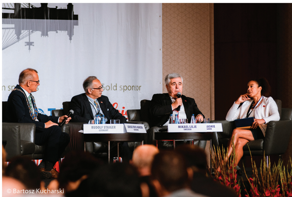
Slika 6. Predstavljanje kandidata za predsjednika FIG-a.

Osim tehničkog i društvenog dijela kongresa, održana je i generalna skupština FIG-a na kojoj su izabrani novi predsjednik i dva potpredsjednika FIG-a za mandatno razdoblje 2023. – 2026. Za predsjednicu FIG-a izabrana je Diane Dumashie iz Engleske (slika 6 – prva s desne strane), a za potpredsjednicu Winnie Shiu iz Sjedinjenih američkih država te Daniel Steudler iz Švicarske. Rezultate glasovanja možete pogledati na web stranicama FIG-a: https://www.fig.net/news/news_2022/09_general_assembly_results.asp . Diane Dumashie je kandidirao Kraljevski institut ovlaštenih inženjera geodezije iz Engleske, Ujedinjeno Kraljevstvo. Winnie Shiu je kandidiralo Nacionalno društvo profesionalnih geodeta iz Sjedinjenih američkih država. Daniela Steudlera je kandidirala tvrtka GEOSUISSE iz Švicarske. Svi kandidati imali su se priliku predstaviti tijekom kongresa (slika 6) i raspravljati sa svim sudionicima i predstavnicima nacionalnih asocijacija, udruženja, uprava i tvrtki koje su članice FIG-a s pravom glasa na generalnoj skupštini. Na generalnoj skupštini Hrvatsku je predstavljao predsjednik Hrvatskoga geodetskog društva koje je član FIG-a Rinaldo Paar (slika 7).