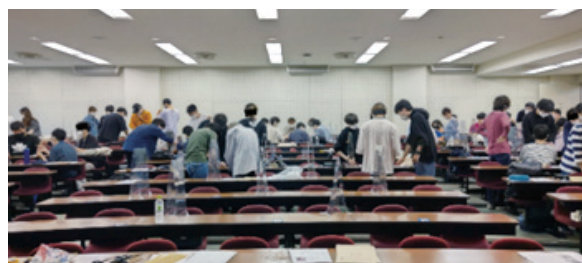
Figure 2 授業中の教室全景