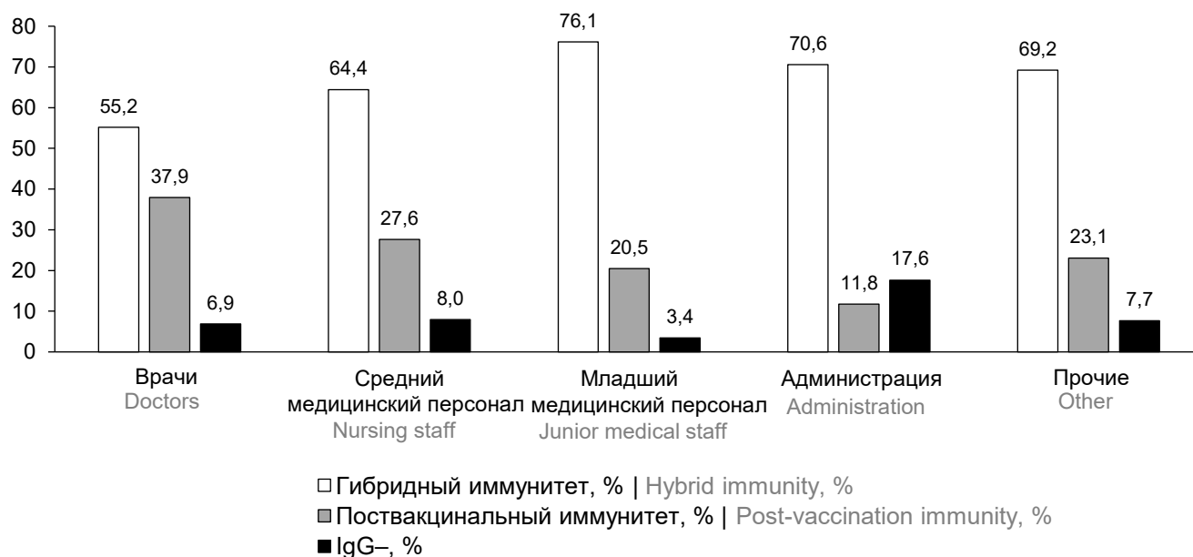
Рис. 1. Сравнительные данные по видам иммунитета в различных профессиональных группах.

Во всех профессиональных группах выявлялись лица с разными видами иммунитета: гибридным, поствакцинальным и с отсутствием IgG-антител к RBD Spike SARS-CoV-2. При этом удельный вес лиц с гибридным иммунитетом также превалировал во всех профессиональных категориях, находясь в пределах от 76,1% (максимальный уровень среди младшего обслуживающего персонала) до 55,2% (минимальный уровень среди врачей; рис. 1 ).