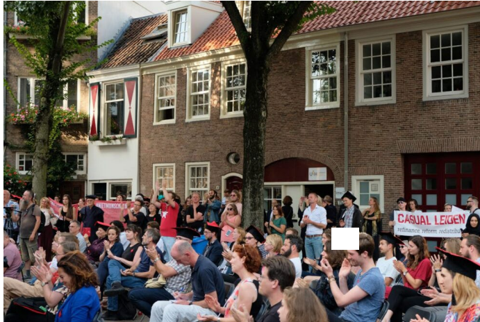
Aanwezigen tijdens de 'ware opening van het academische jaar' door o.a. WOinActie op het Pieterskerkhof in Utrecht.

21 oktober 2021 | Demissionair minister Van Engelshoven zegt al vier jaar dat de inadequate financiering van universiteiten pas in een volgend kabinet kan worden verholpen, dus dat zal nu moeten gebeuren, schrijven auteurs van WOinActie. De benodigde 1,1 miljard moet dan echter wel goed worden besteed. "Het broodnodige budget mag niet naar prestigeprojecten gaan, niet naar nóg meer beheerspersoneel, niet naar mensen die zich met marketing en studentenwerving bezighouden en ook niet naar grotere beleidsruimte voor bestuurders", betogen zij. In plaats daarvan moet het wetenschappelijk personeel eerst worden betaald voor het werk dat ze nu vaak in hun eigen tijd moeten doen.