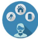
Keuze en regie voor deelnemers