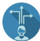
Actieve betrokkenheid zonder dwang