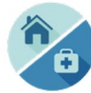
Scheiden van wonen en zorg