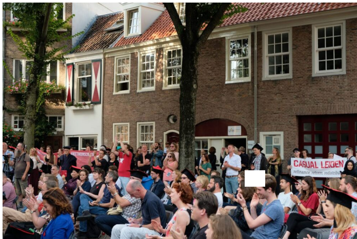
Aanwezigen tijdens de 'ware opening van het academische jaar' door o.a. WOinActie op het Pieterskerkhof in Utrecht.

21 oktober 2021 | Demissionair minister Van Engelshoven zegt al vier jaar dat de inadequate financiering van universiteiten pas in een volgend kabinet kan worden verholpen, dus dat zal nu moeten gebeuren, schrijven auteurs van WOinActie. De benodigde 1,1 miljard moet dan echter wel goed worden besteed. "Het broodnodige budget mag niet naar prestigeprojecten gaan, niet naar nóg meer beheerspersoneel, niet naar mensen die zich met marketing en studentenwerving bezighouden en ook niet naar grotere beleidsruimte voor bestuurders", betogen zij. In plaats daarvan moet het wetenschappelijk personeel eerst worden betaald voor het werk dat ze nu vaak in hun eigen tijd moeten doen.