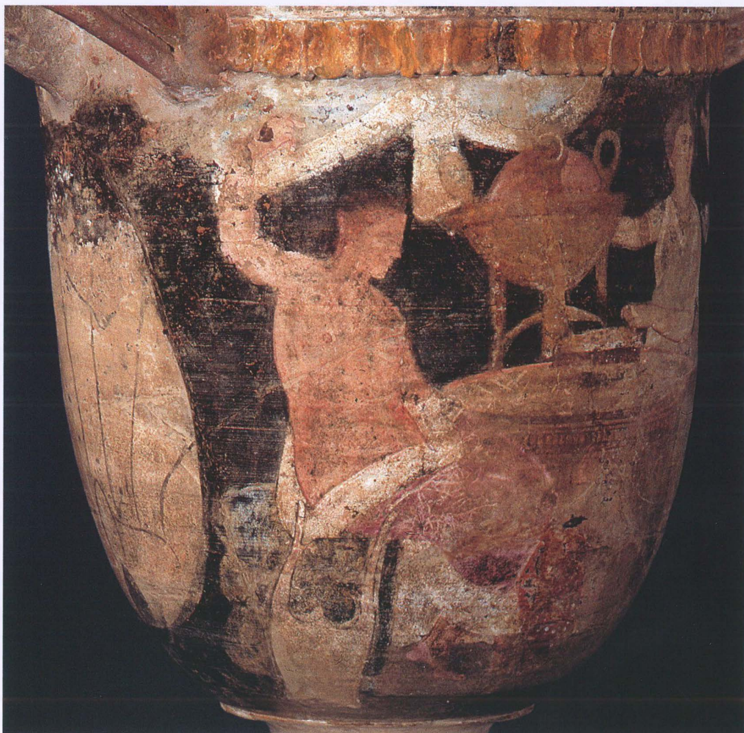
2. Detail van de pyxis

tot langdurige samenwerking te komen bij herkomstonderzoek.