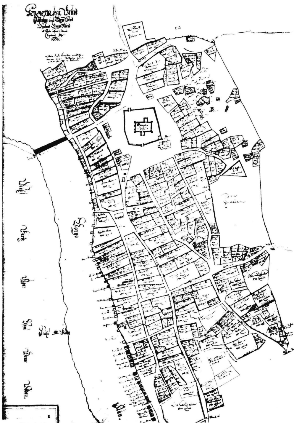
Karta över Borgå stad 1696. Riksarkivet, Stockholm. Återgiven efter Hiekkänen 1981.