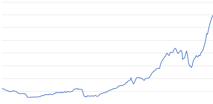
Figura 1: Evolución del PBI per Cápita Perú, 1795-2015